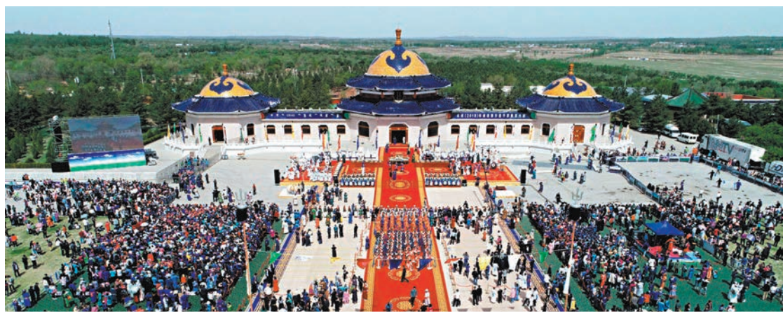
◆成吉思汗的死因成謎。圖為內蒙古成吉思汗陵。

植物在不同環境下都努力生長，展現頑強的生命力，我們欣賞植物之餘，亦要學會珍惜和愛護它們。