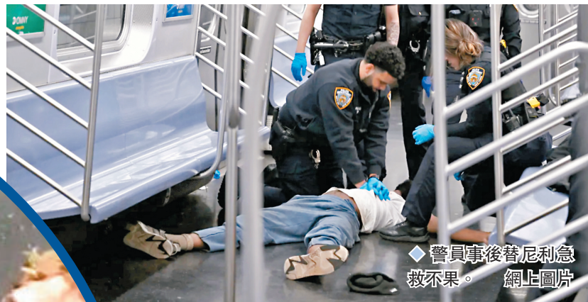
警員事後替尼利急救無果。