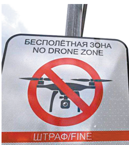
克宮一帶守衛森嚴，到處都有禁止使用無人機警告。

據塔斯社援引當地緊急情況部門的消息報道，俄羅斯南部的克拉斯諾達爾邊疆區伊里斯基煉油廠遭不明無人機襲擊，一座油庫起火燃燒。