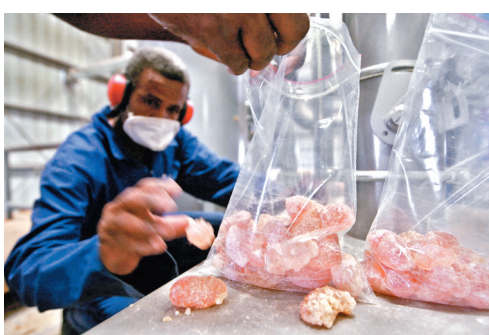
蘇丹工人將阿拉伯膠成品入袋。

燥後無色無味，常作為穩定劑、增稠劑或乳化劑添加到食品中。從可口可樂、雀巢朱古力到M&M's朱古力豆，都有添加微量的阿拉伯膠。世界銀行統計顯示，全球前年阿拉伯膠貿易總額為3.6億美元(約28.2億港元)，其中美國進口約2萬噸，價值約6,600萬美元(約5.2億港元)。