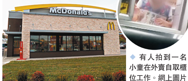
有人拍到一名小童在外賣自取櫃位工作。

香港文匯報訊 蘇丹局勢動盪影響當地對外貿易，尤其一種名為阿拉伯膠的原材料供應受阻，恐會影響全球的可樂、朱古力和紅酒等食品生產。《華爾街日報》指出，全球約80%的阿拉伯膠都產自蘇丹，是碳酸飲料、糖果和部分化妝品的關鍵成分，雖多數企業擁有充足庫存，但產品價格或因供應不穩持續波動。