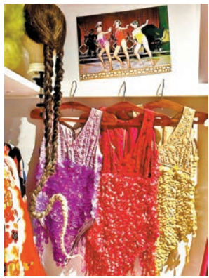
◆「無中生有」香港電影美術及服裝造型展，在邵氏公司倉庫4萬多件舊戲服中挑選出經典作品，用以展覽。作者伊圖

叫人特別感動，香港電影美術學會副會長劉天蘭說：「感激邵氏公司，讓我走進藏有4萬多套積累數十年起伏跌宕的倉庫裏，尋找其代表性的戲服用以展覽，猶如越過高山又越過谷！」 難為了劉姑娘在服裝群山中，收窄範圍條理分明從經典及具有時代代表性落墨。邵氏明星閃爍好比天上繁星，要選一個明星……4屆亞洲影后——林黛，無可比擬！林黛經典電影頗多，1961年電影《不了情》深扣人心，展品中重見銀幕上今天幾乎不可能再複製的上世紀六十年代旗袍，更可從中推戴影后當年曲線玲瓏的身段，那些年，女性的腰肢怎能那麼瘦小？《不了情》之外，林黛飾演設計師及模特兒的電影《花團錦簇》，內裏多款旗袍更是繁花似錦的代號。 同為六十年代，邵氏與時俱進，請來日本導演井上梅次拍攝多套青春氣息逼人的歌舞電影，1969年電影《釣金龜》的口碑與票房都是佼佼者，3位主角：何莉莉、丁佩及秦萍舞台上的舞衣及充滿六十年代阿哥哥風格的迷你裙，再現眼前，跟林黛的經典旗袍並排，不到十年，猶如兩個世代，觀者一目了然。