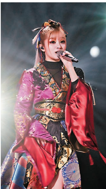
◆日本歌手美依禮芽在B站擁有「最高彈幕禮遇」的美譽。

此番節目舞台別具巧思。主打一個「在水一方、匯聚中華」的概念，舞台在舞美的加持中，一會是翻湧着浪花的蔚藍海面，一會是向四周延伸開來的無邊界水中央，一會又有來自江南海北的風和漂浮的雲……在山水海洋天空的自然意象轉換中，女性風采和自信也隨着一個個舞台表演漸次開來。