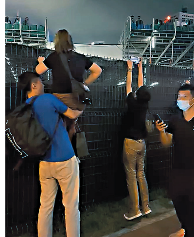
◆未能購票的粉絲不顧安全想爬牆進入會場。