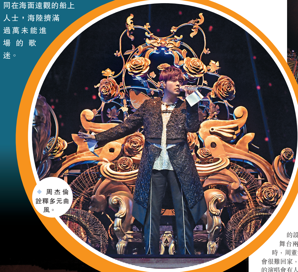
◆周杰倫詮釋多元曲風。