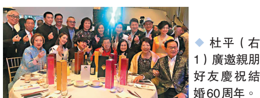
◆杜平(右1)廣邀親朋好友慶祝結婚60周年。

然講大話信口開河,但對方聽到會感到舒服的,夫妻間就應你逗我,我逗你,但最重要就是你欣賞她的優點,你一定要接受她的缺點。」杜平與老友胡楓互登高帽,互相恭賀,胡楓祝賀杜平鑽石婚,杜平則賀胡楓獲金像獎終身成就獎。