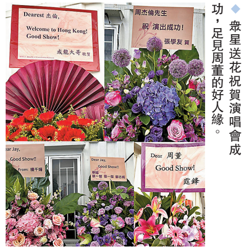
◆眾星送花祝賀演唱會成功,足見周董的好人緣。