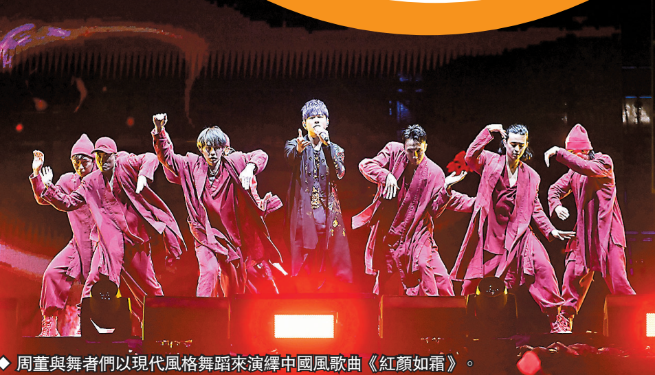
◆周董與舞者們以現代風格舞蹈來演繹中國風歌曲《紅顏如霜》。