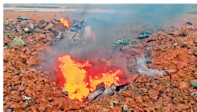
◆F-16在距首爾約60公里處墜毀。

香港文匯報訊 美國軍方表示，一架駐韓美軍F-16戰機昨日在執行例行訓練時，於韓國烏山空軍基地附近墜毀，飛行員彈射逃生，被送至最近的醫療設施治療，事件沒有造成平民受傷。