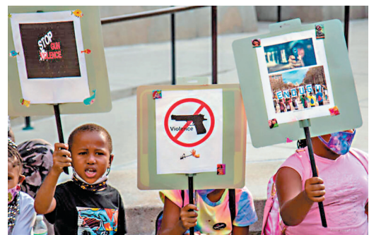
◆疫情期間有民眾抗議槍擊案激增。網上圖片

美國疾病控制預防中心數據顯示，截至2020年，槍支暴力首次超過車禍，成為美國兒童死亡的主要原因。