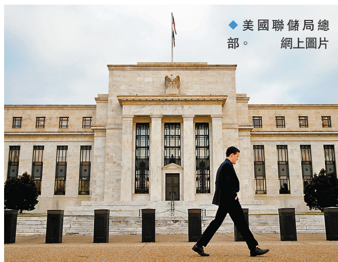
◆美國聯儲局總部。

香港文匯報訊 美國的銀行業危機最近引起廣泛關注，不過，曾擔任華爾街大鱷索羅斯首席策略師的德魯肯米勒，正將注意力轉向美國真正的問題：過度的政府支出和美國失控的巨額債務。 德魯肯米勒認為，無論是近期美國商業地產違約潮，還是中小銀行的接連倒閉，都一定會有結束的一天。但美國31.4萬億美元(約246萬億港元)、且每6個月增長1萬億美元(約7.85萬億港元)的債務，以及200萬億美元(約1,570萬億港元)的表外債務將永遠存在，至少在美國違約或出現惡性通脹之前不會消失。