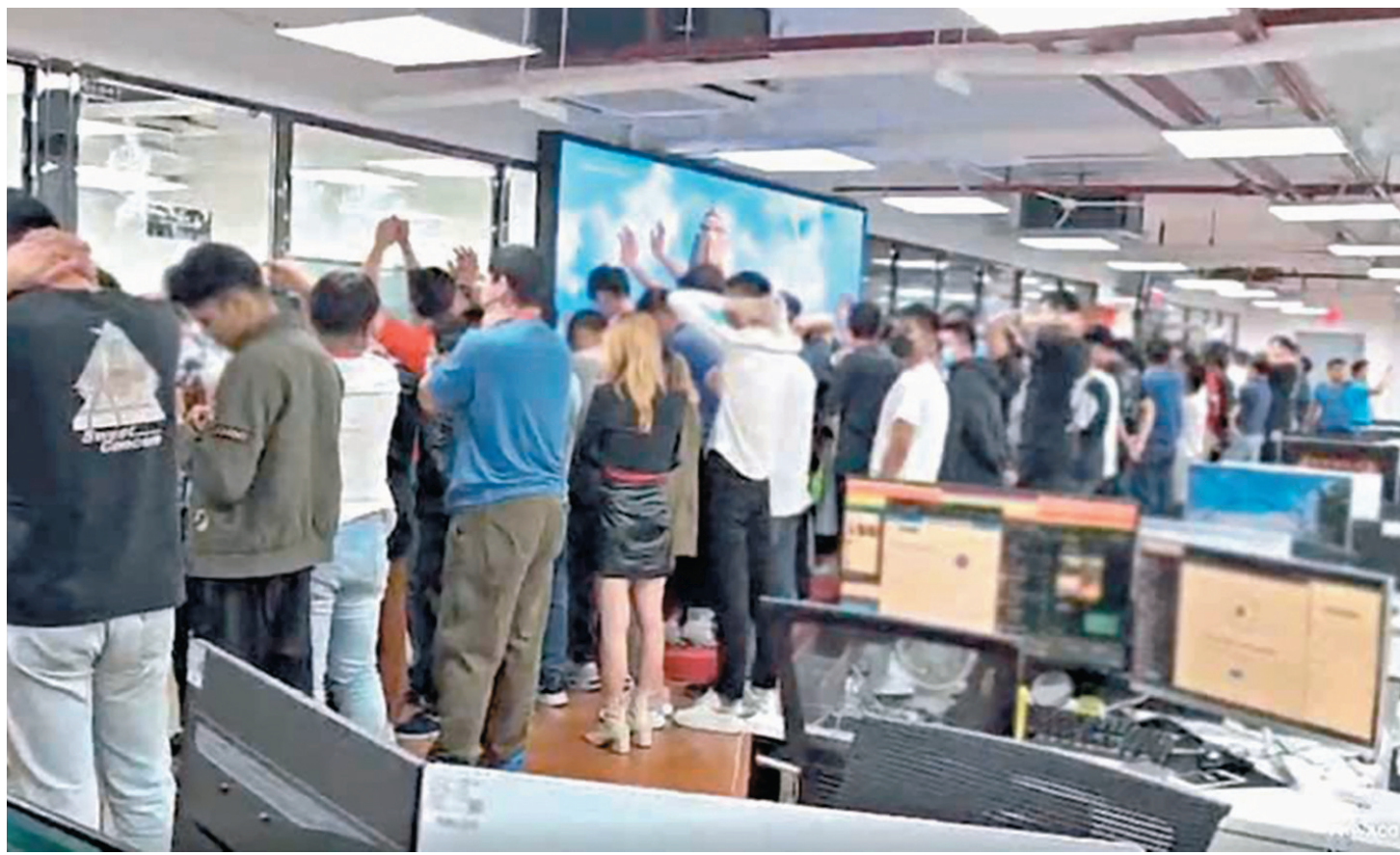
◆菲警方於4日在菲律賓邦板牙省馬巴拉卡特市突擊某電騙公司並逮捕其中12名員工，救出1,000多名據稱是人口販運的受害者。圖為被解救的受害者。

香港文匯報訊（記者趙一存北京報道）菲律賓警察部隊網絡犯罪小組發言人6日表示，菲警方於4日在邦板牙省（Pampanga）馬巴拉卡特市（Mabalacat）突擊某電騙公司並逮捕其中12名員工，救出1,000多名據稱是人口販運的受害者。據菲律賓當地媒體報道稱，被解救人員主要來自中國、越南、印尼及菲律賓當地。其中中國人310名，含1名香港人及2名台灣人。中國駐菲大使館6日發布消息稱，已派員探視被解救的中國公民，並向菲方了解案件情況，核實中國公民信息。使館的工作組要求菲方繼續採取強有力措施嚴厲打擊網絡犯罪，從根本上徹底解決這一社會頑疾。菲律賓方面亦表示將同中方繼續密切執法合作，共同打擊跨國犯罪行為。