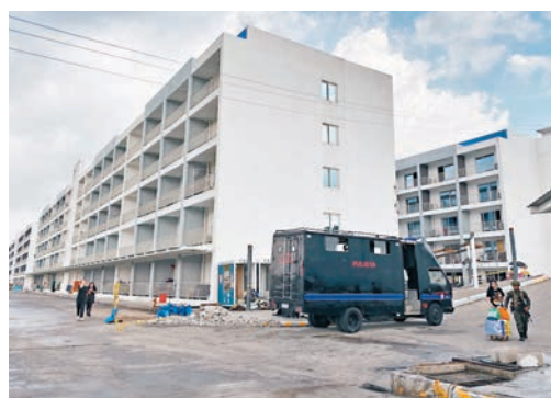
◆駐菲使館將會同菲方做好被解救中國同胞後續身份核查等處置工作。圖為電騙集團所在園區。