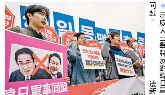
示威人士舉牌反對韓日軍事同盟。

午，韓國多個市民團體在首爾市中心舉行集會，抗議岸田文雄訪韓。示威民眾表示，日本須正視歷史，就強徵勞工、慰安婦等問題真誠謝罪，並對受害者及家屬進行賠償。在日本政府沒有付諸具體行動之前，韓國政府加速改善韓日關係的行動是在展開親日賣國的「屈辱外交」。