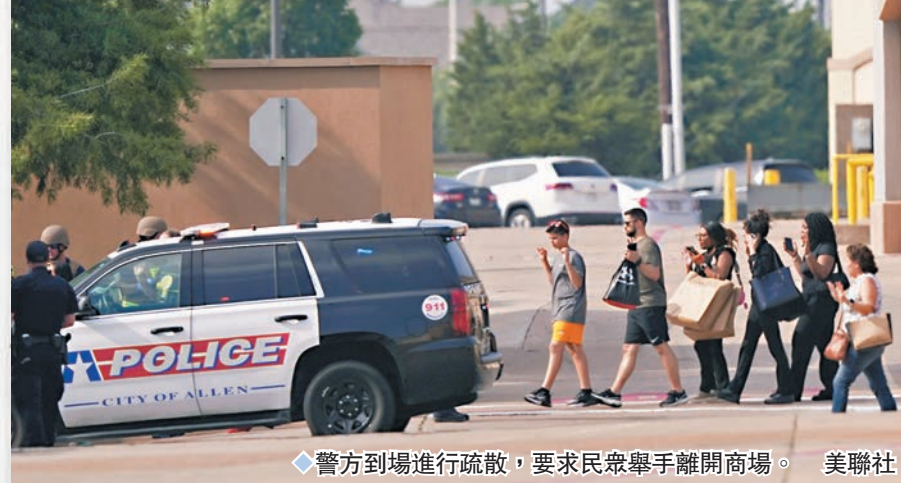
警方到場進行疏散，要求民眾舉手離開商場。

據美國「槍支暴力檔案」網站統計，全美今年已發生199宗造成至少4人傷亡的大規模槍擊事件，因各類涉槍事件死亡人數超過1.46萬人。美國各地近期槍擊案不斷，就在前日凌晨，加州奇科市一間大學附近舉辦的派對也發生槍擊事件，造成一名17歲少女死亡、5人受傷。