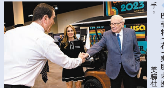
巴菲特(右)與股東握手。

巴菲特指出，儘管美政府採取了對鈔票銀行存戶擴大存款擔保的特殊措施，但消費者仍然感到擔心和困惑，稱「這是不應該發生的」。他指監管部門必須找方法懲處決策失當的銀行高層。他指若當局不出手保障鈔票銀行的存戶，將會帶來災難性後果。