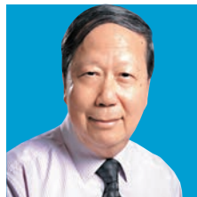
周全浩教授 能源及股市分析家、 浸會大學退休教授、 專欄作家「張公道」