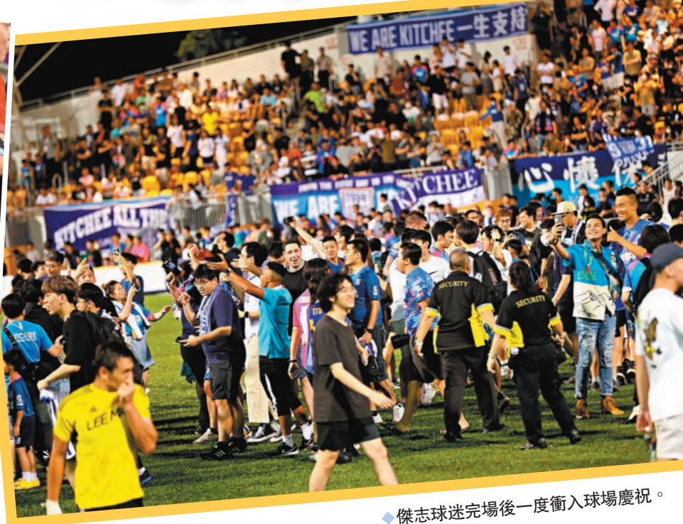
傑志球迷完場後一度衝入球場慶祝。