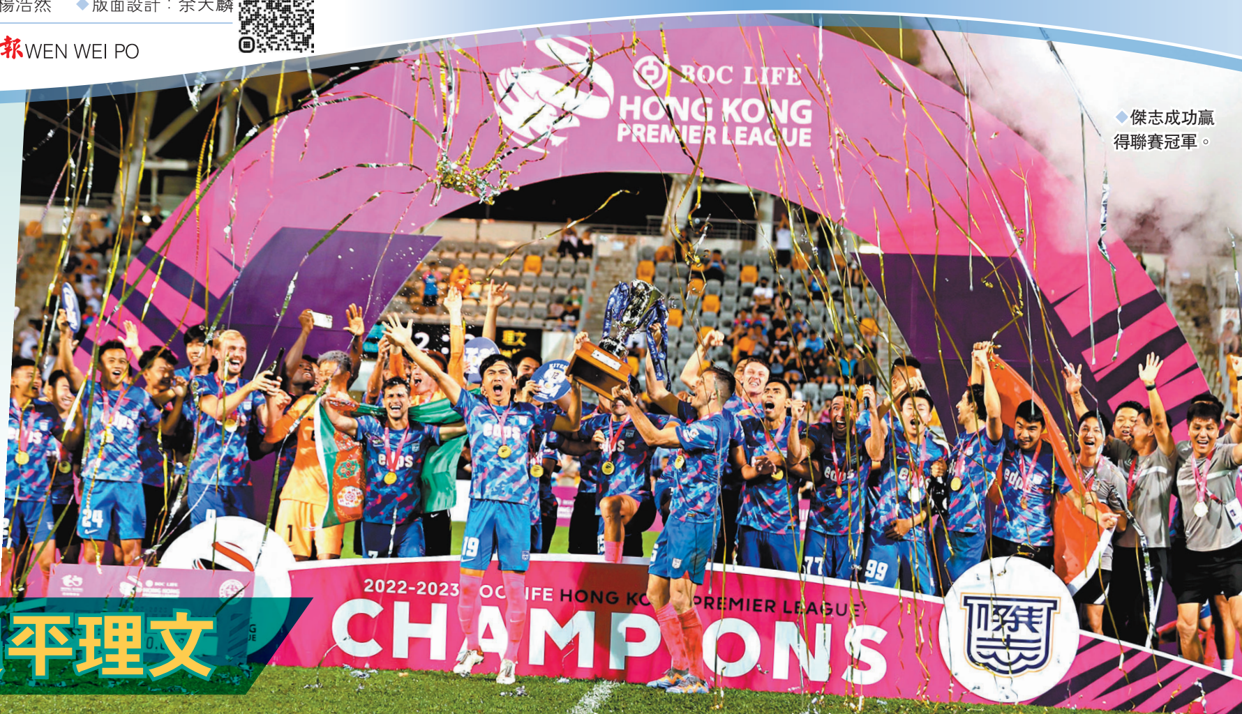
傑志成功贏得聯賽冠軍。