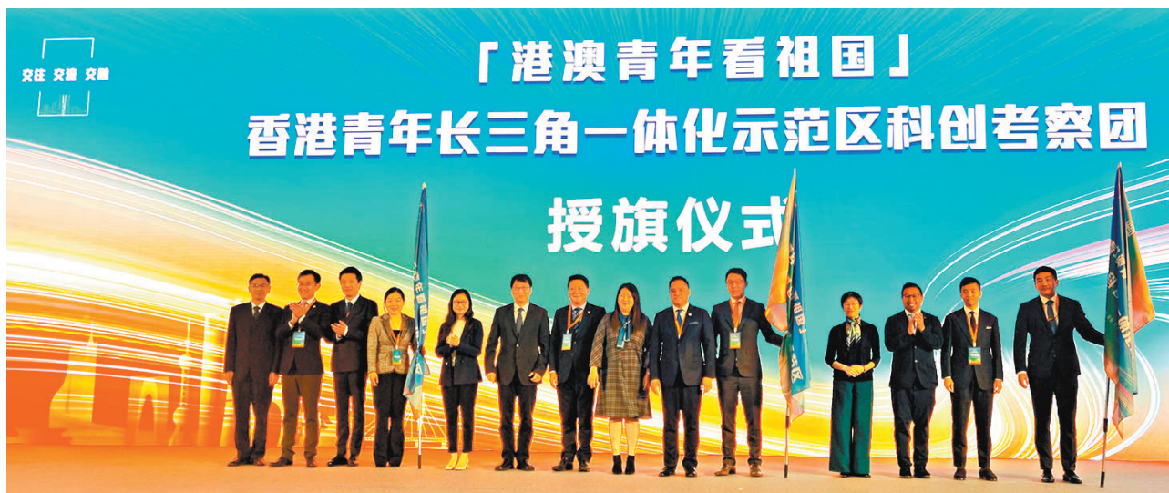
◆滬港嘉賓為港澳青年團員們授旗。

共青團上海市委副書記鄒斌表示，城市與青年總是雙向奔赴，相互成就。希望通過這次考察，港澳青年可以加深對上海和長三角地區歷史文化、經濟發展、營商環境的了解，一起把握機遇，追逐夢想，集中各方智慧，凝聚各方