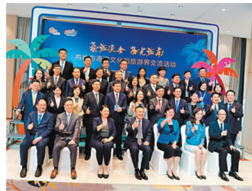
◆各界嘉賓在「藝海流金·陽光海南」活動合照。

香港文匯報訊（記者 何玫 海南報導）由國家文化和旅游部、海南省政府共同主辦，國務院港澳辦支持的「藝海流金·陽光海南」內地與港澳文化和旅遊界交流活動，昨日在海口開幕。國家文化和旅游部副部長盧映川、海南省政府副省長謝京、澳門中聯辦副主任嚴植輝、澳門特區政府社會文化司司長歐陽瑜、香港特區政府文化體育及旅遊局局長楊潤雄、香港中聯辦宣文部副部長張國義，及內地與港澳文化和旅遊界代表等約170人出席。