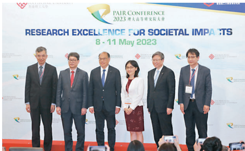
▲理大舉辦交叉學科研究及開發大型會議。

因應AI成為近年的大熱工具，顏寧在講解環節中特別警告青年科研人員，在使用AI協助研究時需要特別小心。顏寧解釋，因為AI是依賴過往的數據進行分析