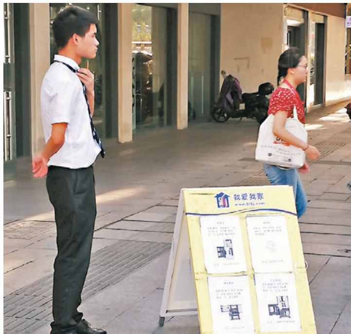
◆內地提出全面在各市縣推行經紀從業人員實名登記。