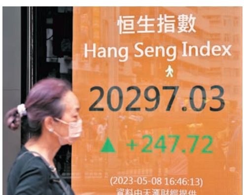
◆恒指昨漲1.24%，全天成交1,081億元。

香港文匯報訊(記者 周紹基)市場對經濟衰退憂慮降溫，美股上周五造好，加上A股表現亮麗，恒指昨高開78點後愈升愈有，全日升247點，收報20,297點，成交1,081億元，大市「三連升」，累升近600點。資金由科技股轉往傳統中資股，四大內銀、「三桶油」等都有追捧。中石化(0386)、中海油(0883)、中行(3988)、神華(1088)及農行(1288)都創今年新高。市場人士認為，港股後市能否再向上，還需看科技股可否「接力」，否則當升至21,000點左右，大市又會面臨壓力。