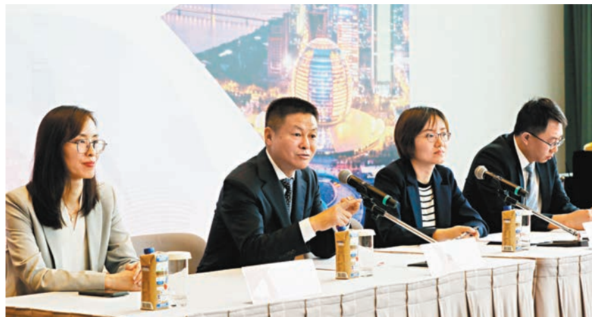
◆浙江省香港現代服務業高端人才招聘會。

他表示，浙江省內的市、鎮、村各有特色，可為人才提供多元化的機遇和生活環境，例如湖州有小橋流水的別致風景，適合享受閒適生活的人士；寧波港是對外貿易的重要港口之一，發展電商業有充足配套，當地政府亦會致力於向人才提供良好環境，「我們負責陽光雨露，你們負責茁壯成長。」