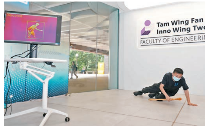
▲系統可實時偵測跌倒等異常情況。