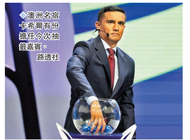
◆澳洲名宿卡希爾有份擔任今次抽籤嘉賓。