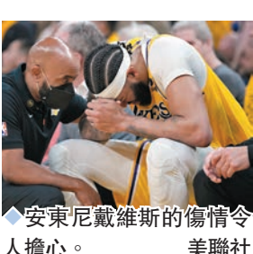
◆安東尼戴維斯的傷情令人擔心。

美職籃(NBA)季後賽當地時間10日展開兩場準決賽較量，西岸方面，背水一戰的金州勇士以121:106力克洛杉磯湖人，場數改寫為落後2:3。東岸賽場，賽前同樣1:3落後的紐約人以