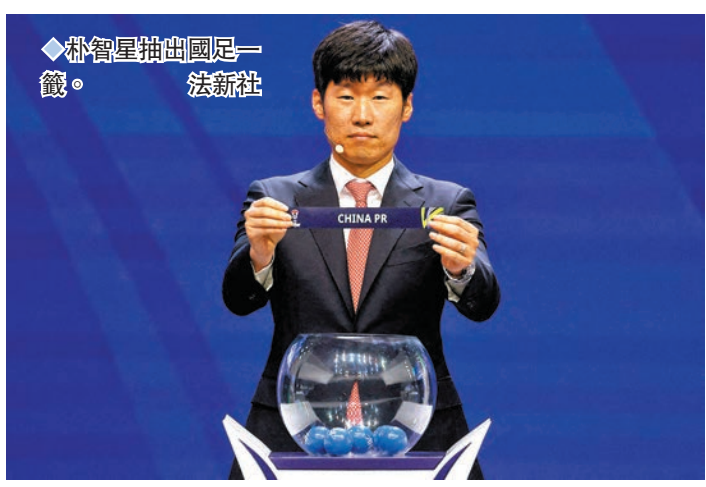
◆朴智星抽出國足一籤。