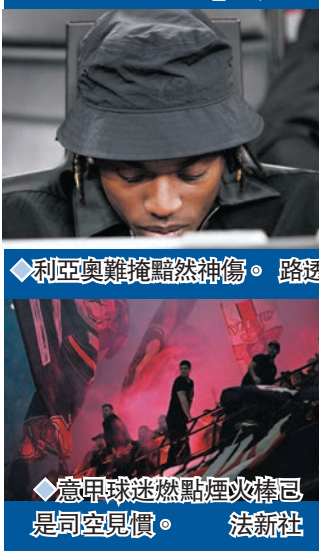
◆利亞奧難掩黯然神傷。