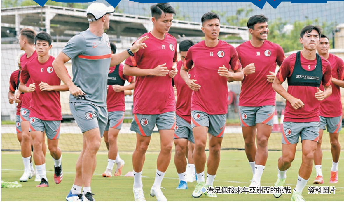
港足迎來來年亞洲盃的挑戰。 資料圖片