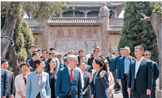
◆巴赫(前排中)到訪山東曲阜。