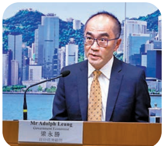
◆梁永勝有信心今年私人消費繼續上升。

在旅遊業及消費需求帶動下，本港今年首季經濟明顯改善。政府昨公布首季GDP修訂數字，按年增2.7%與預估一致，終止先前連續4個季度的跌勢。經季節性調整後，按季急升5.3%，是兩年來最強反彈。政府經濟顧問梁永勝昨指出，本港目前整體消費信心較之前增強，「好多以前做唔到的現在可做」，料今年疫後復常及經濟轉好的因素可抵消息口上升、出口下跌等負面因素，維持今年經濟增長3.5%至5.5%的預測，若目前經濟復甦的動力持續，增長率將靠近預測區間上限，屆時將回復2019年疫前水平。