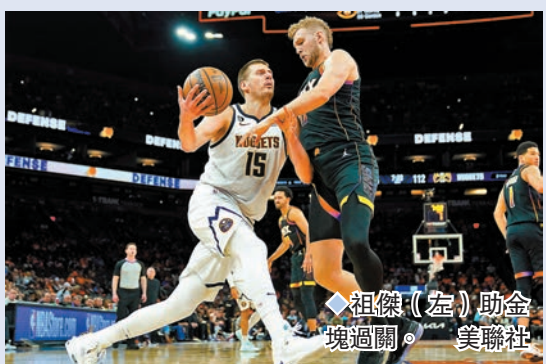
◆祖傑(左)助金塊過關。

2020年殺入西岸決賽但被湖人淘汰，希望今次情況會有所不同；相比起當時我們已更成熟，故希望屆時能夠作突破。」 同日東岸準決賽，塞爾特人作客以95:86擊敗76人，總場數達成3:3兼可在決勝負的第7戰有主場之利。