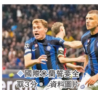
◆國際米蘭暫要全取3分。