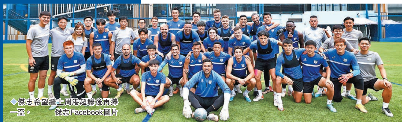
◆傑志希望繼上周港超聯後再捧一盃。