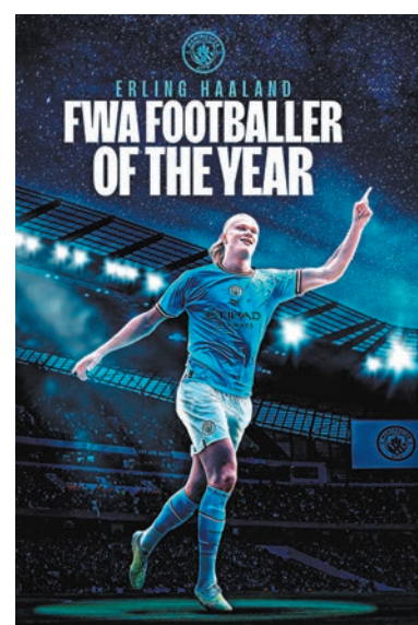
◆夏蘭特破得票紀錄當選英格蘭足球先生。

香港文匯報訊(記者 郭正謙 楊浩然) 效力曼城的挪威前鋒艾寧夏蘭特，昨日以達82%得票率當選本季英格蘭足球先生。 由英格蘭足球記者協會(FWA)選出的英格蘭足球先生昨日公布結果，結果夏蘭特的得票率達到82%，成為歷來贏得此獎項的最高得票球員。今季在所有比賽已合共攻入51球的夏蘭特表示：「首季加入英超便贏得此重要獎項是我的光榮，我十分享受在曼城的的日子，在此要感謝一眾為我提供大量入球機會的隊友，沒有他們我無法贏得此獎項。」