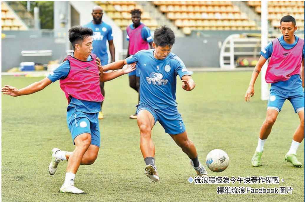
◆流浪積極為今年決賽作備戰。

足總盃決賽今日下午3時於旺角大球場開戰，相隔20年再闖盃賽決賽的標準流浪，遇上有丹恩奴域及明加索夫缺陣的傑志，全隊都希望能夠繼青英盃雙殺對手後再下一城，期望助球會繼1994年至1995年球季後，再次取得本地賽事錦標。今場比賽如90分鐘賽和將加時再戰，再和則以互射12碼決勝。(無綫翡翠台今日3:00p.m.直播) ◆香港文匯報記者 黎永淦