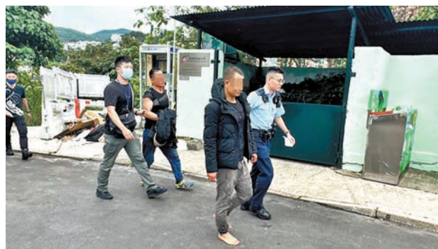
警員帶走兩名內地男子調查。