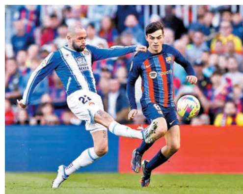
◆巴塞(右)是役贏愛斯賓奴即可捧盃。

香港文匯報訊(記者 楊浩然)西甲「一哥」巴塞隆拿將於香港時間周一凌晨登場，數字上球隊在這場「加泰隆尼亞打吡」作客擊敗愛斯賓奴即可捧盃，而以近況計巴塞該可順利完成奪冠任務。(now611及632台周一3：00a.m.直播)