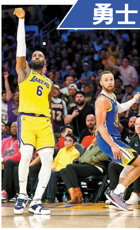
◆有占士(左)壓陣的湖人擊敗居里所屬的勇士。

NBA勁旅湖人昨天成功在季後賽關鍵第6戰主場以122：101告捷，以4：2淘汰衛冕冠軍勇士，晉級西岸冠軍戰。湖人主力安東尼戴維斯全場出賽約40分鐘，拿下17分、20籃板、2助攻，回顧2019至2020年賽季加盟湖人，當年就在泡泡園區和隊友勒邦占士聯手拿下總冠軍，但由於全關在園區內比賽，也沒主客場制，外界一直為這座金盃打上問號。揚言想「再度震驚世界」的戴維斯接受採訪時說：「想要和占士再拿一座總冠軍，現在我想是時候了。」此外，已38歲的占士證明自己「還有油」，這場關鍵戰打了43分鐘，拿下30分、9籃板、9助攻，這也是占士自2020年10月9日總冠軍賽後，再在季後賽單場得到30分以上。勇士方面，教練卡爾賽後指雖然不認為近年建立起的所謂「勇士王朝」將告終，但至少承認這回是對湖人打得較好：「我為球隊、選手感到難過，但當下是表現較佳的隊伍勝出，這很現實。我們沒遺憾，但被淘汰真是糟透了。」