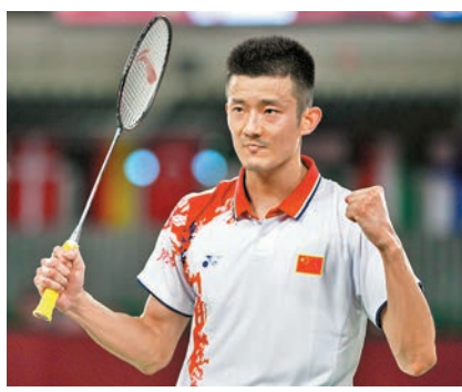
◆謨龍在2021年後已沒有比賽。資料圖片

2023年蘇迪曼盃世界羽球混合團體錦標賽，將於今日在蘇州啟幕。國羽單打主教練夏煊澤昨日透露，名將謨龍已經正式退役。據悉謨龍會隨隊征戰本屆蘇迪曼盃，並為年輕球員提供指導。今年34歲的謨龍出生於1989年，2006年，年僅17歲的他進入國家隊，隨後一路成長為國羽的頂樑柱之一。2014年羽毛球世錦賽，謨龍決賽戰勝馬來西亞名將李宗偉，摘得職業生涯首個單打世界冠軍頭銜，並於同年登頂成為世界第一。1年後，謨龍在錦標賽決賽中再勝李宗偉，成功衛冕。2016年里約奧運會，謨龍又一次在男單決賽中擊敗李宗偉，加冕奧運冠軍。除此之外，他還曾兩度出征奧運會：2012年在倫敦獲得季軍，2021年在東京屈居亞軍。三屆奧運會，三次登上領獎台並集齊金銀銅牌，謨龍解鎖了一項特別的成就。團體賽層面，謨龍曾幫助中國隊多次贏得蘇迪曼盃和湯姆斯盃。據統計，他的世界冠軍數量達到兩位數。東京奧運會和第十四屆全運會結束後，謨龍選擇暫時放下手中的球拍，在丈夫與父親的角色中更多投入。他曾在接受採訪時透露，參加杭州亞運會是自己的夢想。在仁川亞運會男單決賽，負於隊友林丹的謨龍獲得亞軍，他希望能夠在杭州彌補這份遺憾。不過最終謨龍改變了計劃，他征戰賽場的身影也停留在了2021年。