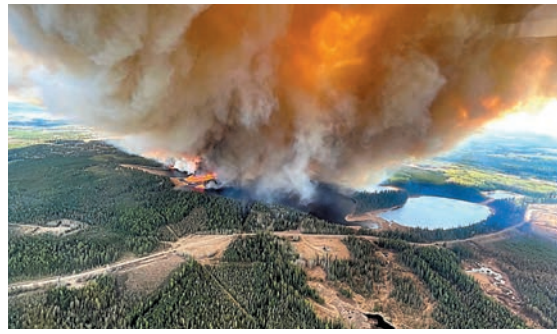
◆艾伯特省多處山火失控狀態。

年已發生421宗山火，較去年同期182宗大增，亦超過2018至2022年任何一年的同期紀錄。與去年相比，今年進入山火季節僅兩個多月，但山火發生數量已達到去年全年總數的三分之一。