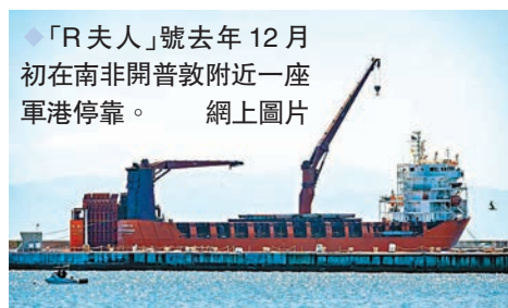
◆「R夫人」號去年12月初在南非開普敦附近一座軍港停靠。網上圖片

俄羅斯「專家」網前日稱，美國近來一直在向南非施壓，要求其拒絕與俄羅斯和中國合作。美國已經威脅對南非實施制裁，然而，美國對南非和非洲國家的壓力愈大，它們就愈與俄羅斯和中國走近，從而進一步削弱美國在非洲的影響力。