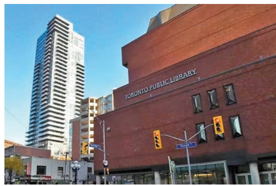
◆各地公共圖書館暴力事件頻仍，令到一些人擔心安全。

藥物泛濫、暴力行為普遍和社會安全網削弱。她提到不少人在疫情後變得孤立無援，他們覺得公共圖書館是最後救兵，圖書館切勿把他們拒之門外。