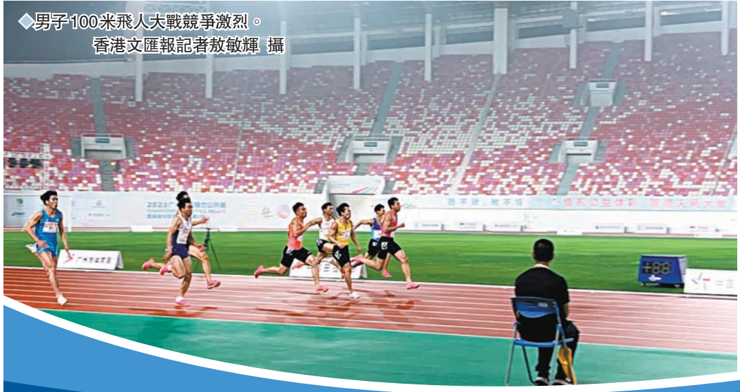
◆男子100米飛人大戰競爭激烈。