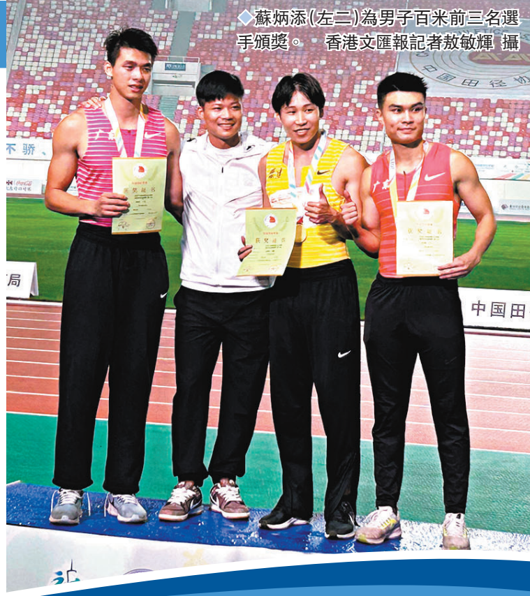
◆蘇炳添(左三)為男子百米前三名選手頒獎。

記者了解到，本次大賽，蘇炳添不僅錄製視頻為選手打氣，蘇炳添速度研究與訓練中心還是大賽的支持單位，可以看出他對田徑事業十分關心，支持不遺餘力。