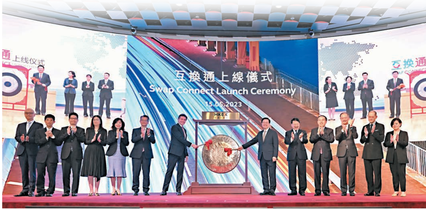
◆北向「互換通」昨日啓動。在香港，特首李家超和港交所行政總裁歐冠昇負責敲鑼；中聯辦副主任尹宗華，特區政府財政司司長陳茂波、財經事務及庫務局局長許正宇、金管局總裁余偉文等出席上線儀式。

北向「互換通」昨日啓動，首日成交合約共涉82.59億元人民幣。香港特區行政長官李家超表示，北向「互換通」是首次在金融衍生工具領域引進互聯互通安排，新措施將強化香港作為全球最大的離岸人民幣業務中心和國際風險管理中心的地位。國務院港澳辦副主任王靈桂則指，中央支持香港與內地不斷提升金融合作水平，助力國家穩步推進金融市場對外開放，吸引更多國際資本到內地投資，分享中國的發展紅利，並在過程中不斷增強香港競爭優勢，推動香港經濟實現更高品質發展。 ◆香港文匯報記者 岑健樂