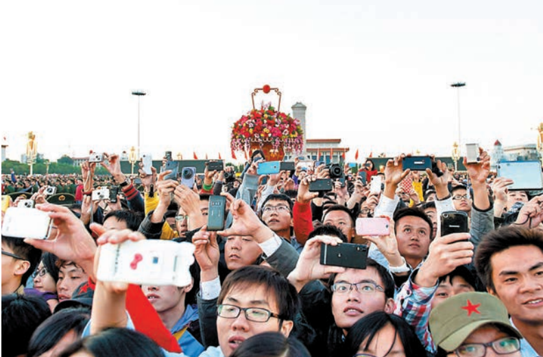
◆群眾在天安門廣場觀看升旗儀式。

護我國旗，壯我國威！春風拂面，首都北京驚飛喜報，端門和午門之間的甬道上，國旗護衛隊員們正在進行訓練，他們威武挺拔，隊列整齊，步伐鏗鏘，氣勢如虹，口號聲響徹雲霄。這就是國旗護衛隊，被國人譽為「中國最帥的國旗」；這就是國旗護衛隊，新時代展示大國風采和強軍風采的威武之師！