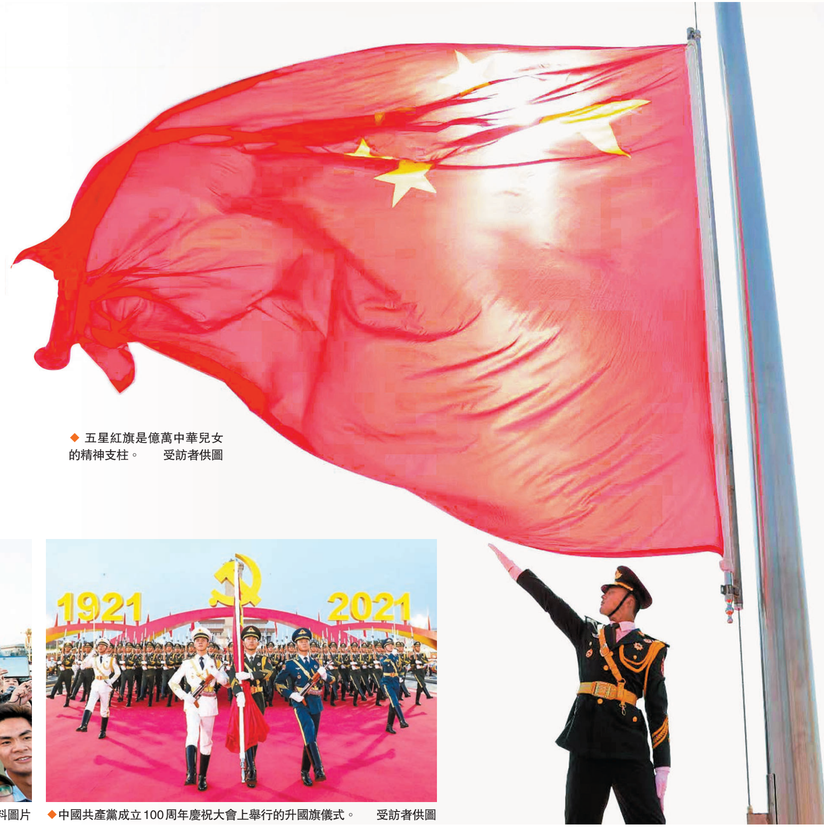
◆五星紅旗是億萬中華兒女的精神支柱。

護我國旗，壯我國威！春風拂面，首都北京驚飛喜報，端門和午門之間的甬道上，國旗護衛隊員們正在進行訓練，他們威武挺拔，隊列整齊，步伐鏗鏘，氣勢如虹，口號聲響徹雲霄。這就是國旗護衛隊，被國人譽為「中國最帥的國旗」；這就是國旗護衛隊，新時代展示大國風采和強軍風采的威武之師！