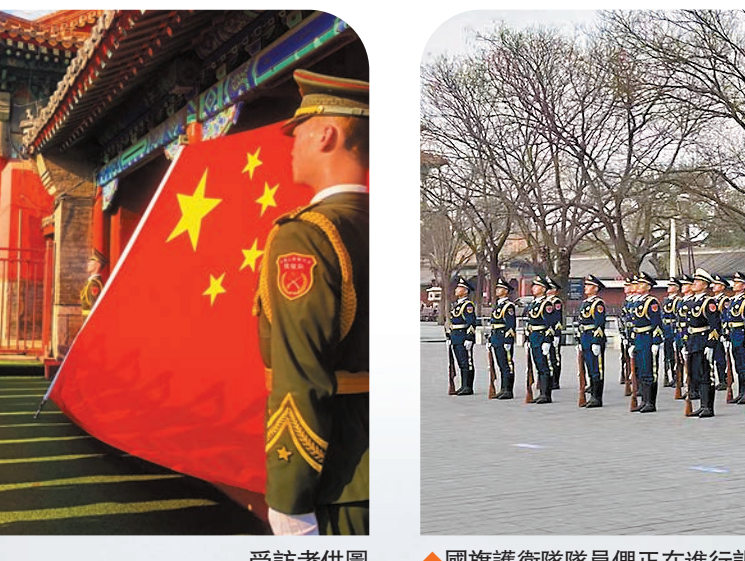
◆退伍老兵向國旗敬禮告別。受訪者供圖