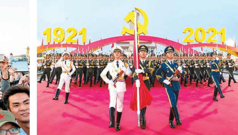
資料圖片 ◆中國共產黨成立100周年慶祝大會上舉行的升旗儀式。受訪者供圖

晨曦中的天安門廣場，高高飄揚的五星紅旗與英男無畏的「國旗衛士」相映成畫，成為中國人心中最美最麗的風景。到天安門廣場觀看升旗儀式是很多人一定要完成的心願，風雨無阻！元旦、五一、國慶等節日時，更會有十幾萬國人凌晨便聚在天安門廣場，只為觀看升旗儀式。他們有的胸前佩戴國旗，有的手中揮舞國旗，就連口罩都印有國旗。他們隨著激昂的樂曲高唱國歌，以崇敬的目光注視五星紅旗冉冉升起，高呼「祖國萬歲」。中國人將國旗擺在無比神聖的位置，這種深沉溫暖且充滿力量的禮讚，是對祖國繁榮昌盛最美好的祝願。