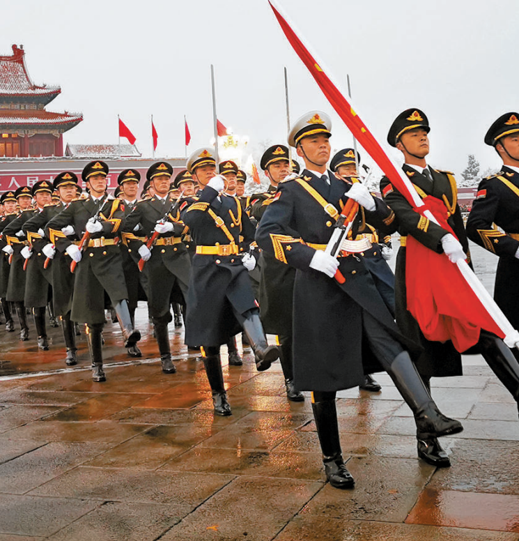
◆戰士們在冬日裏冒着雨雪進行升旗儀式。