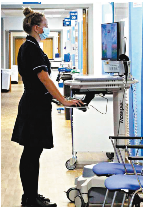
◆NHS醫護可共享查閱患者就醫紀錄。

受害人透露，跟蹤她的女醫生任職劍橋亞登布魯克醫院。去年7月，受害人與男友確定關係後不久，該名女醫生便開始將受害人敏感資料轉給其男友，包括受害人、她的姊姊和子女的許多醫療私密信息，「我聽說該名女醫生自稱是從朋友處得到這些信息，有時又說是從我的孩子就讀學校的學生家長了解到。這些信息只有我們的親人和密友知道，對方此舉顯然對我們懷有惡意。」