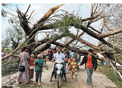
◆受災地區布滿倒塌的樹幹及雜物。

今次風暴令緬甸通訊設備受損，聯合國開發計劃署一名顧問指出，在對外通訊幾乎中斷下，外界很難掌握當地災情規模。