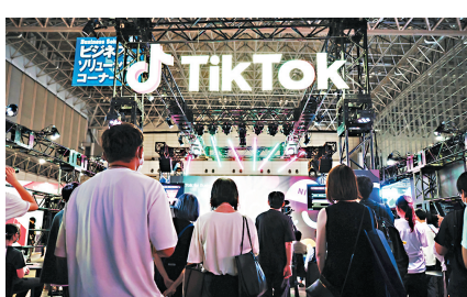
◆TikTok在海外大受歡迎。

北京和深圳等創新中心的創辦人則表示，外國客戶願意為加快業務流程或實現自動化功能的技術付費。