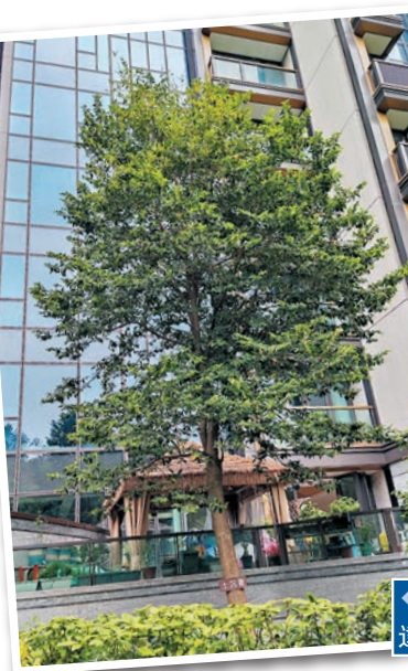
◆為原址保留這棵土沉香，新地安裝深達17米的維護槽。

國家二級保護植物的野生土沉香需要保育，新地施工期間花費約數百萬元來保護該樹，包括於2018年超強颱風山竹襲港期間作出圍封保護，及犧牲約10個車位安裝深達17米的維護槽等，並令整個建築期因而延長約兩個月。