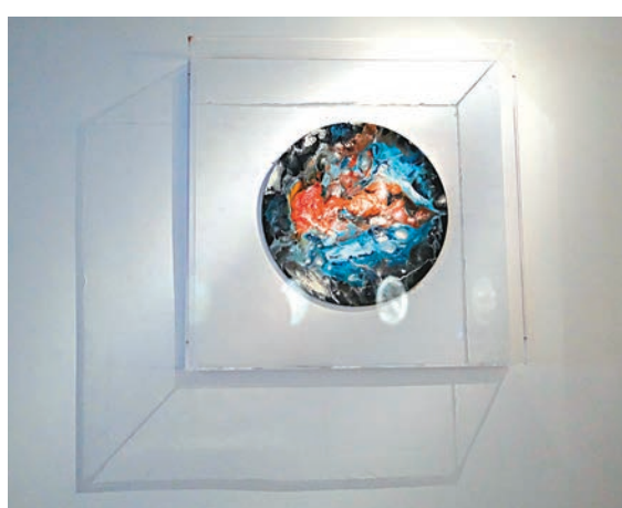
◆藝術家2016年的舊作《花蕊》。

由展覽的玄關，預備心情「入畫」，然後踏入 G/F「柔軟」區域，腳踩柔軟之地。一直向前走，穿過窄小入口，進入半黑的「風」區域，近距離觀看三幅 Rolland 最常創作的大圓畫。沿樓梯到 1/F，一個全黑的「速度」區域，地上布滿半反光黑布，反映最遠處的多媒體裝置藝術。