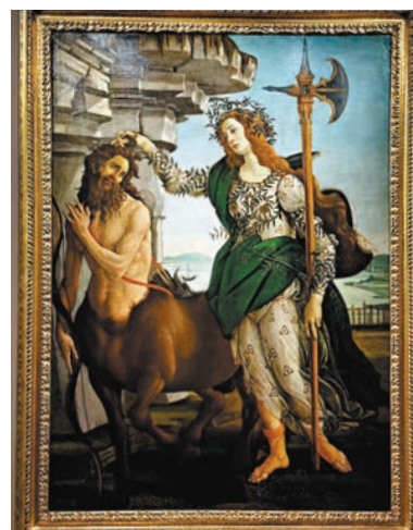
張帆攝 ◆首次來華展出的《女神帕拉斯·雅典娜與半人馬》。張帆攝