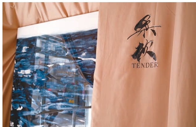
◆展覽以時間為主題，分為「風」、「柔軟」和「速度」三個區域。