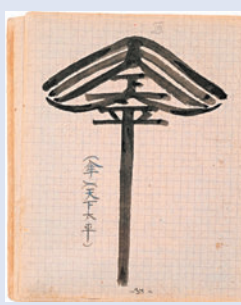
溥儀手稿筆記本內容。