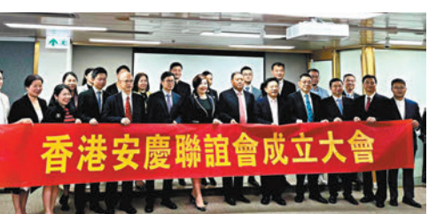
香港安慶聯誼會日前舉行成立大會。

安徽省安慶市又名宜城，是中國歷史文化名城、中國優秀旅遊城市、國家園林城市，並有中國「黃梅戲鄉」之稱。