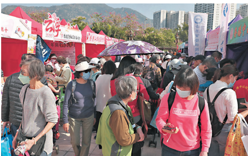
香港廣東社團總會、工聯會屯門地區服務處去年聯合舉辦第二屆「家鄉市集」。

將使用維園4個硬地足球場及半個中央草坪舉辦是次活動，場內除了設置逾200個展銷攤位外，還有打卡熱點、親子工作坊、攤位遊戲等。其間，來自香港本地歌手亦將與內地歌手、各地表演團體獻上逾百個精彩的舞台表演，為香港市民提供一個平價購物、欣賞表演、親子遊樂的休閒好去處。