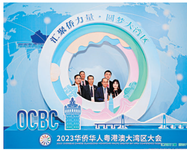
與會嘉賓在會場拍照打卡。