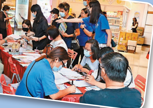
顧客服務—零售/酒店/旅遊和其他