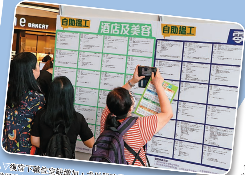
復常下職位空缺增加，尤以服務業增長最多。圖為「職場熱身賽」招聘會情況。