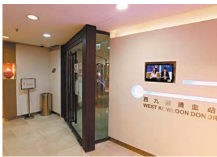
大部分捐血站將於下周五佛誕公眾假期照常開門。圖為香港紅十字會西九龍捐血站。香港紅十字會輸血服務中心表示，血庫只有4天存量。