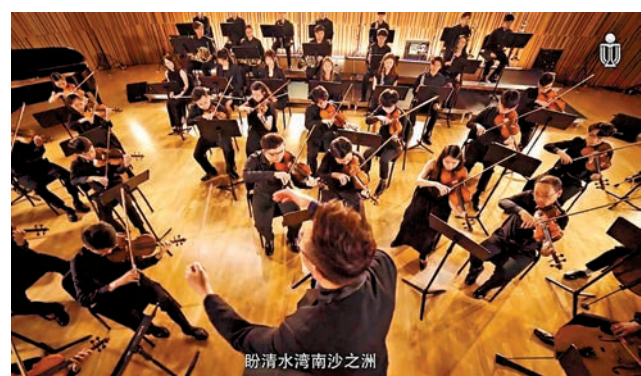
香港科技大學創校三十年，早前一口氣推出普通話、廣東話及英語版校歌。