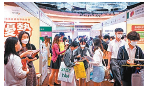
教育局昨日及今日在九龍灣國際展覽中心舉辦「多元出路資訊SHOW 2023」。圖為公眾參觀攤位。

為推動職專教育，教育局推出先導計劃，讓自資院校將課程重組成「應用學位」，加強職業發展元素，首輪的四個課程包括明愛專上學院的護理學、都會大學檢測和認證應用、香港高等教育科技學院（THEi）的園藝樹藝及園境管理，及東華學院的應用老年學業已於2022/23學年取錄第一批學生。