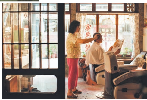
◆電影榮獲大阪亞洲電影節兩項大獎「觀眾票選獎」及「最佳演員獎」。

《本日公休》帶出的訊息。大家在台北去髮廊只是想要把頭髮弄漂亮，彼此在生活上沒有什麼關聯，家庭髮型特別之處是髮型師與顧客的熟絡關係，生活中事無大小，家庭髮型阿姨就陪伴你度過了人生的很多時刻，可能有人說是很美好的「老派」人情……當你想看看，現世代的年輕人無論吃飯、走路都是望著/按著那手機是「低頭一族」，對食肆前後左右建築物均一無所知，在家裏也是跟閣下傳訊息溝通，人與人之間的關係日漸疏離，家庭髮型阿姨在某個瞬間就擔當著如「樹洞」般的角色，聆聽顧客的傾訴，有時更好像擔任心理治療師的角色去為顧客與子女間的關係調解，非常微妙。