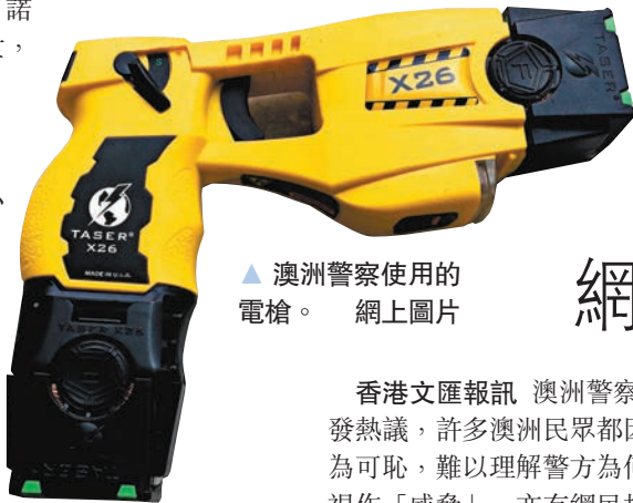
▲ 澳洲警察使用的電槍。網上圖片

香港文匯報訊 澳洲警察用電槍電擊95歲老婦事件，在社媒引發熱議，許多澳洲民眾都因警員的粗暴執法感到震驚，甚至形容為可恥，難以理解警方為何會將一名需要助行器輔助行走的長者視作「威脅」。亦有網民批評澳洲社會保障制度存在缺陷，在今次事件中不但未能幫助患有認知障礙的老婦，還讓警方介入，最終釀成悲劇。 在社媒Twitter上，有澳洲網民留言稱，「她（老婦）明明行動遲緩，你們本可以用一杯茶或一塊餅乾，就能讓她『解除武裝』。」還有網民質問，「不管她手持什麼刀具，你難道不能走