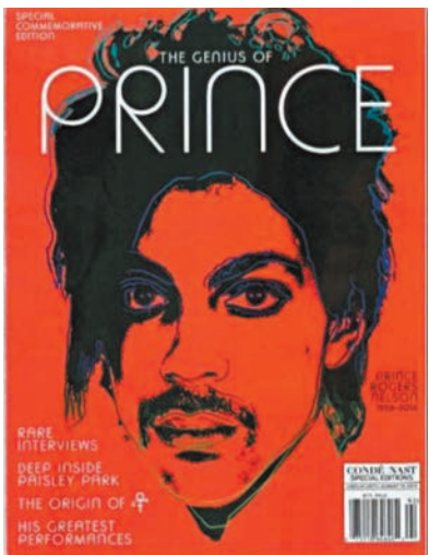
◆ 紀念Prince的特別版雜誌封面。網上圖片

受全球藝術圈矚目。9名大法官當中，部分認為作品作商業用途，目的和性質都不符合「合理使用」原則，最終大比數裁定安迪華荷的作品構成侵權。 戈德史密斯對判決感興奮，形容對於要透過授權作品賺錢謀生的攝影師和藝術家來說，這是美好的一天。至於兩名不認為安迪華荷作品侵權的大法官，則認為裁決可能扼殺創作。