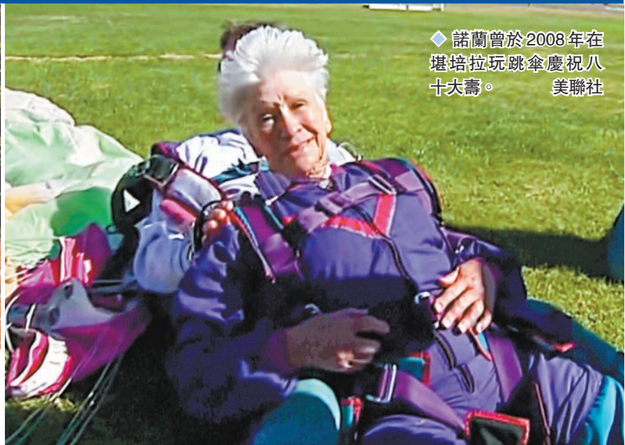
◆ 諾蘭曾於2008年在堪培拉玩跳傘慶祝八十大壽。