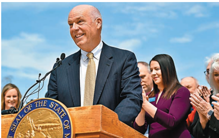
◆ 共和黨籍蒙大拿州州長吉安福特周三簽署禁令。

香港文匯報訊 澳洲警察用電槍電擊95歲老婦事件，在社媒引發熱議，許多澳洲民眾都因警員的粗暴執法感到震驚，甚至形容為可恥，難以理解警方為何會將一名需要助行器輔助行走的長者視作「威脅」。亦有網民批評澳洲社會保障制度存在缺陷，在今次事件中不但未能幫助患有認知障礙的老婦，還讓警方介入，最終釀成悲劇。 在社媒Twitter上，有澳洲網民留言稱，「她（老婦）明明行動遲緩，你們本可以用一杯茶或一塊餅乾，就能讓她『解除武裝』。」還有網民質問，「不管她手持什麼刀具，你難道不能走