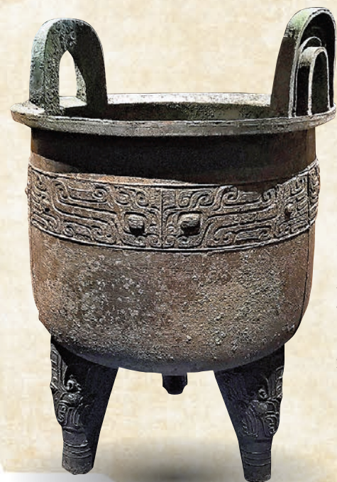
◆獸面紋圓鼎，古代中國，商代(約公元前1600—前1046年)，山西平陸前莊遺址出土，山西博物院藏

業內人士亦認為，今次展覽的舉辦將進一步深化中外文明交流互鑒，增強中華文明國際傳播影響力、中華文化感召力、中國形象親和力、中國話語說服力，為加快推動國家中心城市現代化建設提供文化支撐。為讓大家深刻地了解大河文明，鄭州博物館每天安排5場義務講解，還特別推出「大河文明浪漫曲」集章活動。印章內容以展覽為主題，涵蓋四大文明元素，專門設計紀念票及集章手冊，讓觀眾留下美好的參觀回憶。展覽直至6月3日，觀眾可通過鄭州博物館公眾號預約免費參觀。