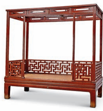
◆明末清初黃花梨六柱架子床