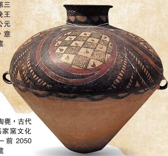
▶重點文物：雙耳彩陶甕，古代中國，新石器時代馬家窯文化(約公元前3300—前2050年)，甘肅省博物館藏