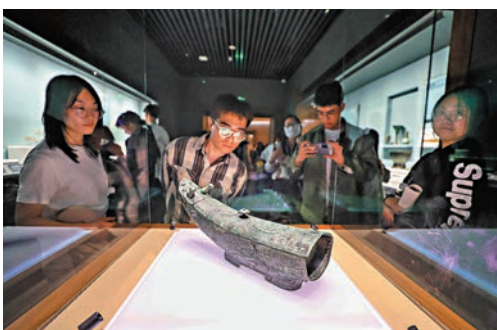
◆參觀者在拍攝龍形軀。

美國華裔捐贈的雲岡石窟流失海外佛首、台灣中禪寺捐贈的唐代鄧峪石塔塔身、流失海外的晉國子犯冢……山西博物院1238件(組)文物作為基本陳列首次對外展出，其中不乏多件流失海外多年的回歸文物。