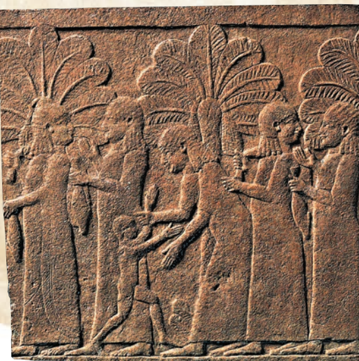
◆雪花石膏押運囚犯浮雕，古代兩河流域，新亞述帝國亞述巴尼拔時期(公元前669—前631年)，底格里斯河流域尼尼微遺址出土，意大利巴拉科古代雕塑博物館藏

我國的黃河、長江，亞洲西部的底格里斯河、幼發拉底河，非洲東北部的尼羅河，南亞次大陸的印度河，都作為文明的母親河為人們所熟知。只是長期以來，儘管在漫長的歷史之中不斷共融，這些大江大河哺育的文明傳統彼此之間足夠自覺的互鑒卻殊為不易。想探尋四大文明古國的秘密嗎？或是來一睹木乃伊的真容，或是來拍照打卡……在今次展覽中，鄭州博物館聯合國內外多家文博單位打造一場難得一見的文化盛宴，展出意大利都靈埃及博物館、東方藝術博物館和山西博物院等共計203件(套)珍貴文物，分為「孕育」、「塑造」、「城與國」、「發展·共生」四個部分，講述了生活在兩河流域、尼羅河流域、印度河流域以及黃河和長江流域的古代人民依靠大河流域發展農耕文明的精彩歷程。