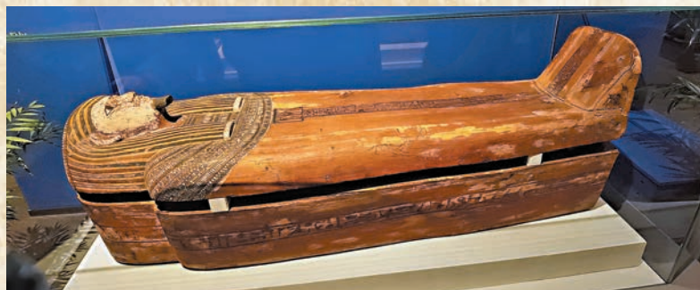
▲木棺，古代埃及，第三中間期第25王朝—晚王國時期第26王朝(公元前747—前525年)，意大利都靈埃及博物館藏