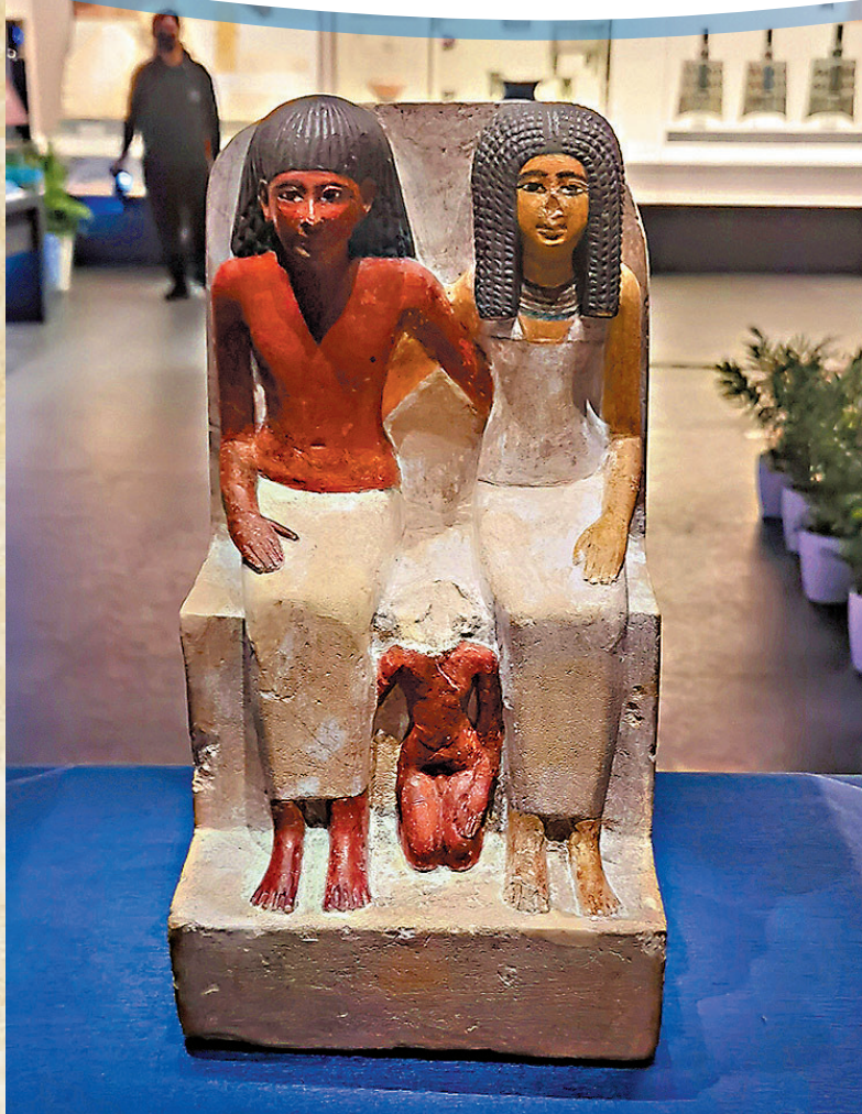
◆石灰岩雕像(父親保羅、母親穆特、兒子薩穆特)，古代埃及，新王國時期第18王朝(公元前1550—前1292年)，尼羅河流域底比斯墓地出土，意大利都靈埃及博物館藏