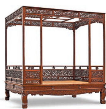
◆明十七世紀黃花梨六柱透雕螭龍瑞獸紋圍子架子床

2020年10月，香港蘇富比拍出了一張「明十七世紀黃花梨六柱透雕螭龍瑞獸紋圍子架子床」，連同成交價為2,316.5萬港元。筆者亦藏有一張「明末清初黃花梨六柱架子床」，簡約清爽的造型為明代傢俱的典型風格。