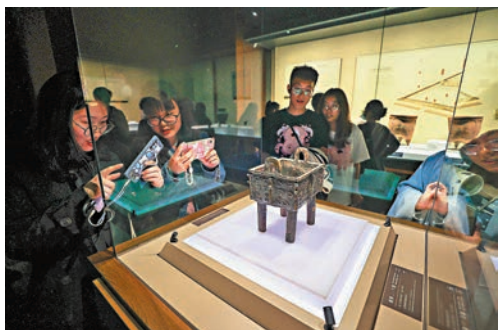
◆參觀者在拍攝寢華方鼎。