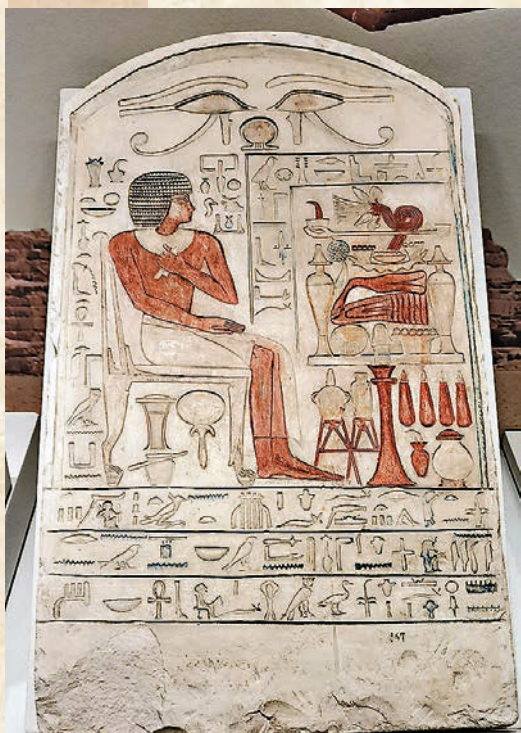
◆石灰岩墓碑，古代埃及，中王國時期(公元前2025—前1700年)，意大利都靈埃及博物館藏