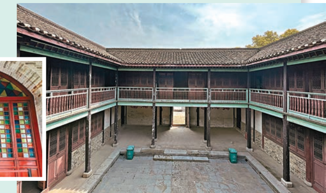
◆受西方建築影響，唐五房圩的轉心樓採用類似蒂芙尼藍的色彩粉飾建築。

在目前保存最完整的唐五房圩轉心樓內，可以看到其建築用料色彩與傳統建築有很大區別，類似蒂芙尼藍的色彩穿插在傳統的磚紅門木之間，形成了鮮明的跳色視覺衝擊。而在劉老圩內，還有被當地百姓稱為「西洋樓」的獨棟建築，這棟樓是典型的西方建築風格，門窗玻璃也選用了當時十分稀少的彩色玻璃作為裝飾。