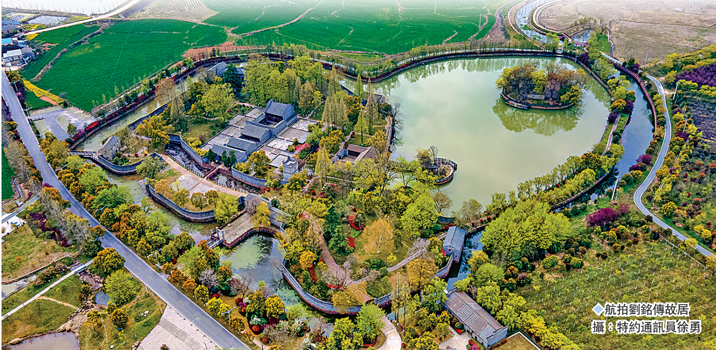
◆航拍劉銘傳故居