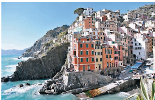
◆里奧馬焦雷景色美