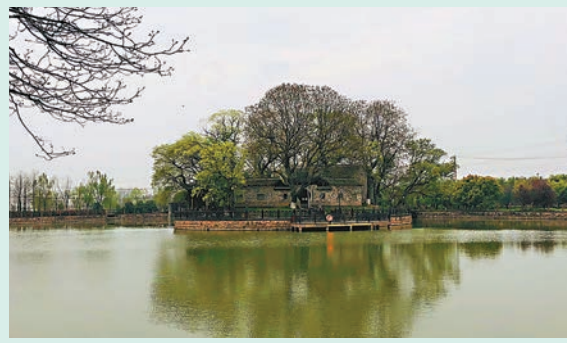
◆劉老圩中專門用於學習的讀書島。

重視教育是淮軍將領的特點之一，從各處圩堡建築中可見一斑。劉銘傳故居劉老圩的讀書島位於圩堡的西北角，小島四面環水，沒有橋，只能通過小船往返圩堡居住區，在此學習，心無旁騖。淮軍將領積極倡導興文重教，劉銘傳在此生活期間，不僅先後捐建肥西書院、廬陽書院等，還捐出銘軍軍餉作為「報效」，以增廣廬州府學額，資助宗族、鄉鄰子弟求學科考等。此外，在淮軍名將周盛波、周盛傳兄弟舊居周老圩內，至今還保存當時專門用於讀書的「花廳」建築，門前的百年狀元橋亦吸引無數學子前來。