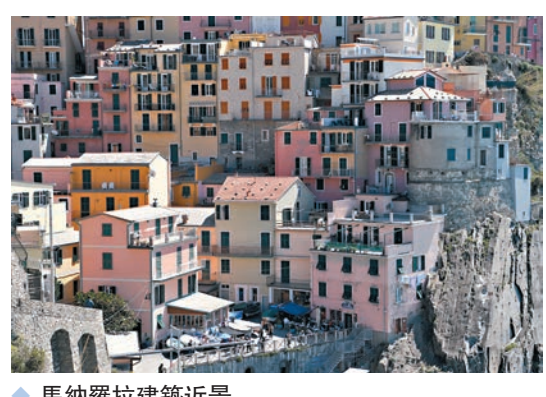
◆馬納羅拉建築近景

位於意大利拉斯佩齊亞省的五村鎮，由里奧馬焦雷、馬納羅拉、蒙泰羅索等五個依山傍海的漁村組成。濱海小鎮背靠亞平寧山脈，俯瞰地中海，色彩鮮艷的建築依陡峭山岩層層而上，風光十分秀麗。