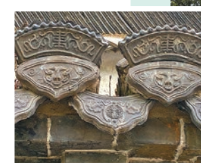
◆防火牆設計採用圓弧形的螭吻造型。