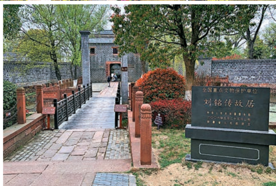
◆劉銘傳故居是淮軍圩堡中最具代表性的建築之一。圖為故居正門處。

從安徽省會合肥市區出發，驅車向西進入肥西鄉間。曾經在此聚集的百餘座圩堡，現存有30多處，其中保存較好及正在修繕的包括晚清時期台灣首任巡撫劉銘傳建的劉老圩、兩廣總督張樹聲修的張老圩、抗日保台名將唐定奎家族的唐五房圩等，均在從合肥市區出發的約1小時車程內。「歡迎來到淮軍名將、首任台灣巡撫劉銘傳故居——劉老圩參觀遊覽……」在解說員的指引下，香港文匯報記者穿過東門樓前的吊橋，走進被劉銘傳親筆題名「大潛山房」的劉老圩，壕堡亭台的壯觀首入眼簾，彷彿又回到了當年淮軍在中華大地縱橫馳騁的風光歲月。