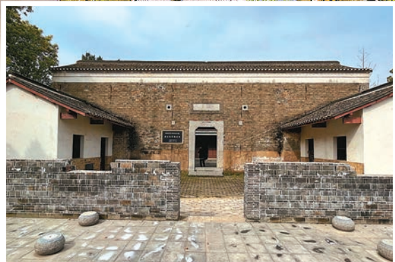
唐五房圩轉心樓正門。