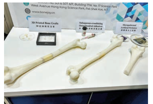
◆膏狀的材料可以 3D 打印預先製成支架，塑成適合傷處的形狀。

Bonejoy 技術總監楊雨禾表示，新材料具有高强度及生物活性，提供最佳機械支撐；