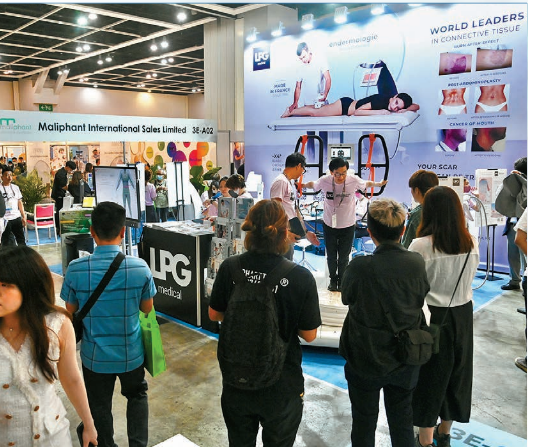
◆由貿發局主辦的第 14 屆香港國際醫療及保健展於 5 月 16 至 18 日在會展中心舉行，展覽匯聚了超過 300 家展商，展示一系列嶄新醫療科技和儀器、保健產品及相關服務等。