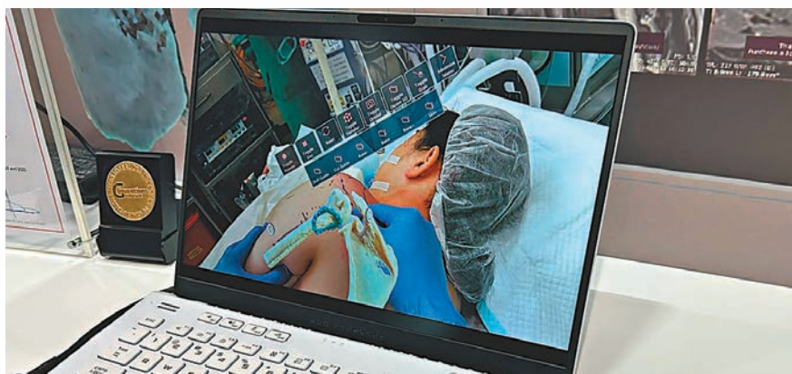
◆雲合科技研發了一套可用於全像透鏡的軟件。