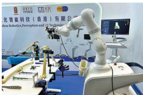
◆元化智能已完成了手術機械臂、導航系統和全部軟件的自主研發。