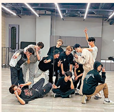
THE BOYZ 近日為巡演備戰。網上圖片

香港文匯報訊 韓國男團THE BOYZ將於6月24日在澳門百老匯舉行《THE BOYZ 2ND WORLD TOUR: ZENERATION in MACAU》，是他們首次到澳門開唱。11人男團THE BOYZ於2017年出道，並在短時間內受到了廣大喜愛。憑藉《THE STEALER》、《THRILL RIDE》、《Maverick》等多首冠軍歌曲，配合強烈的舞蹈和現場演出能力，深受Kpop迷的喜愛。而由前日開始他們便在韓國首爾的奧林匹克體操競技場展開第一站巡