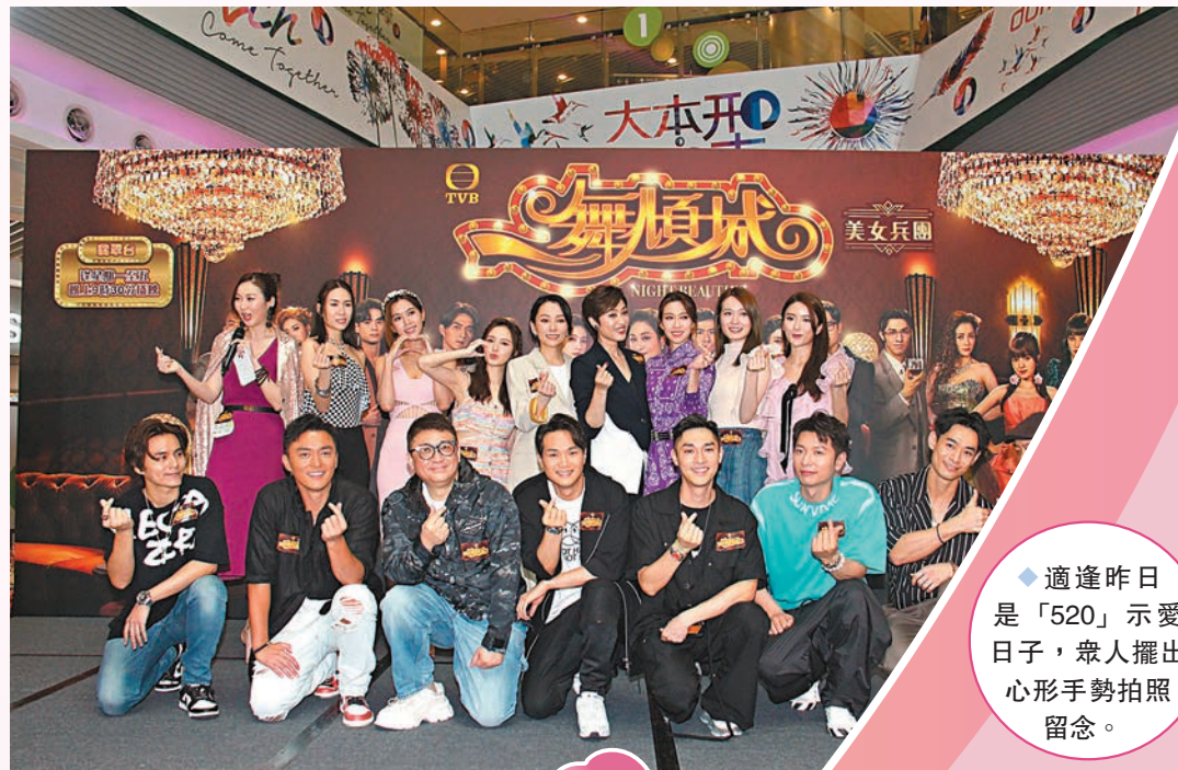
適逢昨日是「520」示愛日子，眾人擺出心形手勢拍照留念。