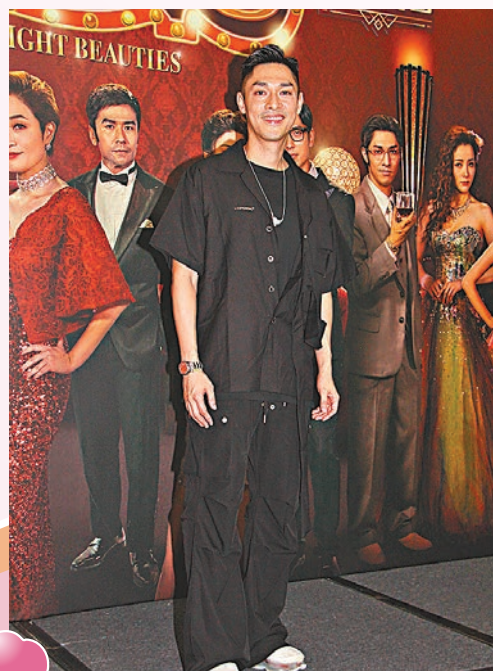
關楚耀有意簡單地去旅行結婚完成婚事。