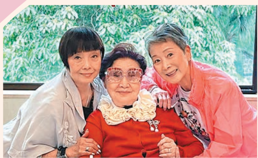
白雪仙(中)與陳寶珠(右)和梅雪詩合照。

香港文匯報訊（記者阿祖）著名粵劇表演藝術家白雪仙前日度過95歲生日，愛徒陳寶珠、梅雪詩、謝雪心及一眾好友陳善之、資深傳媒人汪曼玲等到仙姐家中為她祝賀生辰。由於之前疫情關係，已經有三年沒在仙姐家中開生日派對，今年疫情過後一切復常，又再可以熱鬧開闔為仙姐慶祝。傳媒人汪曼玲分享了仙姐生日派對的照片，仙姐和蝴蝶造型的生日蛋糕合照，背後正正放着任姐任劍輝的照片，任姐照片前還放滿鮮花供奉；另外，仙姐又切燒豬，再跟愛徒陳寶珠和梅雪詩合照。仙姐生日當天，穿上紅色襯衣，精神奕奕笑容滿臉，大家都祝願仙姐95歲生日快樂，長命千歲！