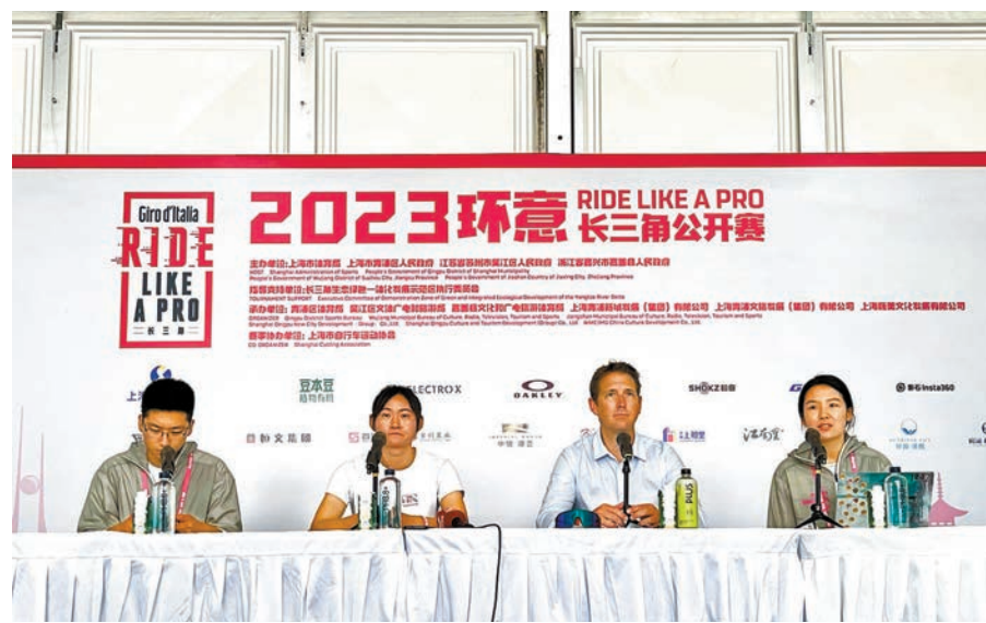
◆奧運冠軍鍾天使(左二)接受媒體採訪。