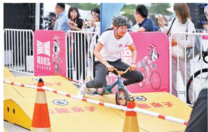
◆鍾天使參加平衡車互動。

值得一提的是，鍾天使作為場地自行車運動員出身，她很希望將神秘的場地自行車推廣開來。「現在我們在崇明的場地自行車場館馬上就要建成了，我希望到時候能跟我們上海體育這一塊把我們場地自行車開放出去。因為目前來說全國是沒有開放的場地自行車場館的，希望能夠通過後面的工作和努力，把這個場館推廣出去，讓大家可以更直觀地感受得到和體驗到。」