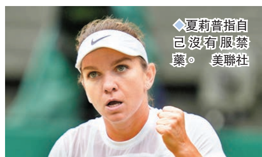
◆夏莉普指自己沒有服禁藥。

國際網球誠信機構(ITIA)於當地時間周五宣布，前網壇一姐夏莉普再次未能通過藥物檢測，外間估計這位羅馬尼亞球手將面臨停賽處分。作為兩屆大滿貫得主的夏莉普於去年8月的美國公開賽後，因未能通過藥檢而暫時被ITIA停賽。至於夏莉普昨日回應指對ITIA的指控難以理解，揚言自己從沒有服用禁藥。 ◆綜合外電