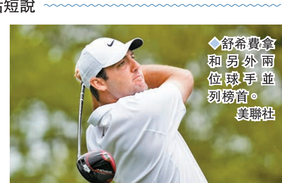
◆舒希費拿和另外兩位球手並列榜首。