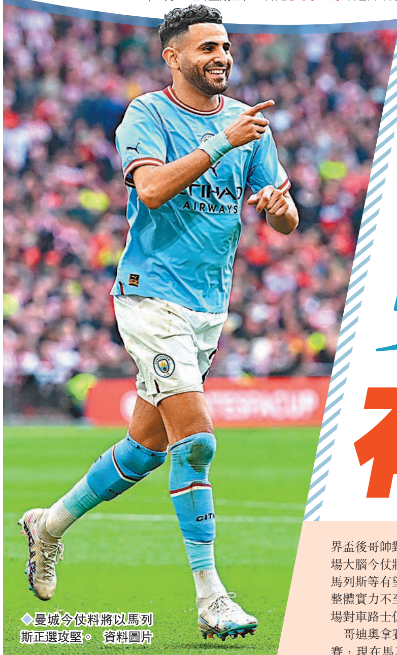
◆曼城今仗料將以馬列斯正選攻堅。資料圖片