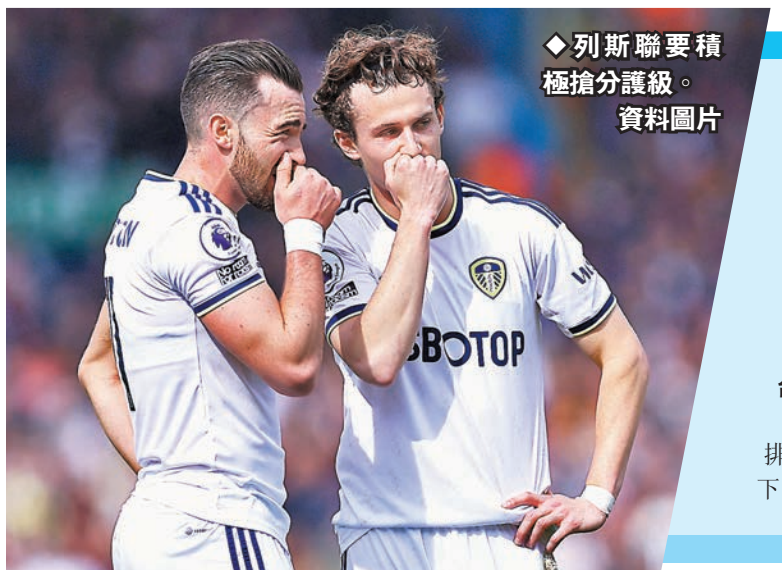
◆列斯聯要積極搶分護級。資料圖片