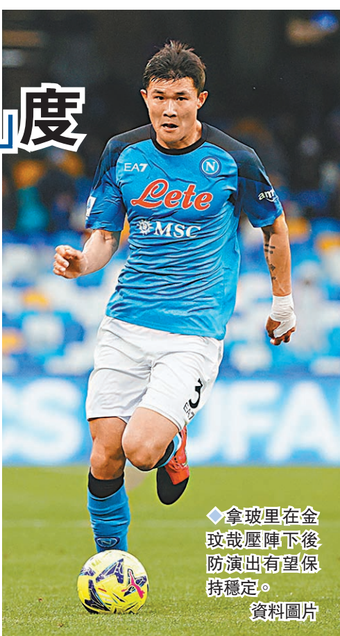
◆拿坡里在金球獎壓陣下後防演出有望保持穩定。資料圖片

至於萊切主場對史柏斯亞的護級戰。萊切目前35戰得32分排第16位，史柏斯亞則35戰得30分排第17位；衡量後上輪勇挫AC米蘭的史柏斯亞信心該較強，值得看高一線。(now639台今晚6:30p.m.直播)