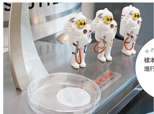
◆「dLhCG」測試樣本送返地球後會進行跟進研究。

他說，以上只是整個構想的第一步，「假如結果良好，而未來還有機會的話，希望可以將移植了『dLhCG』的動物，活體送上太空艙生活半年，從而了解其修復治療效果如何」，再進一步的展望，就是探討能否給動物於太空進行微創移植手術，「再往後就希望能給太空人，或是給上太空的人類使用，基本上就是這麼一個展望。」