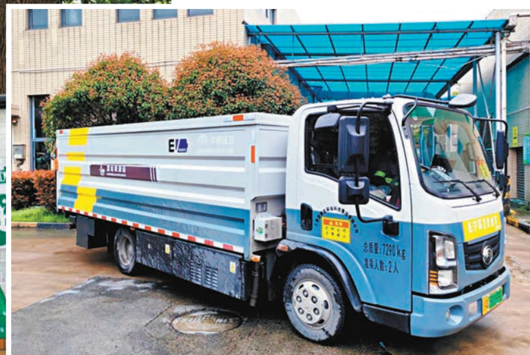
▲上海長寧區新能源濕垃圾車投入使用，實現碳零排放。