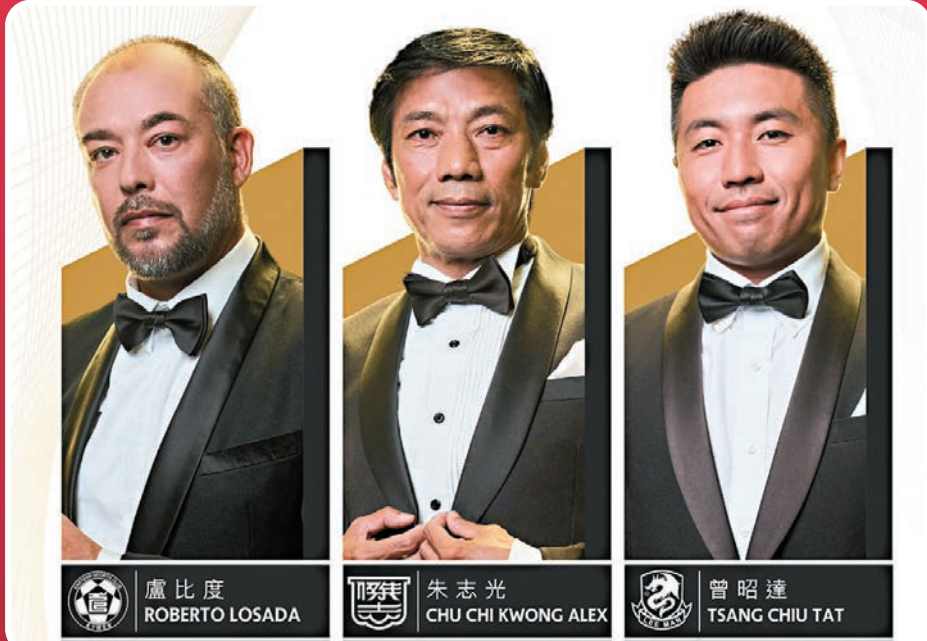
◆最佳教練最後三強。足總圖片