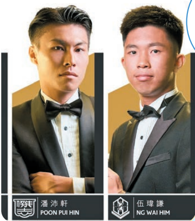
◆最佳青年球員最後四強。足總圖片