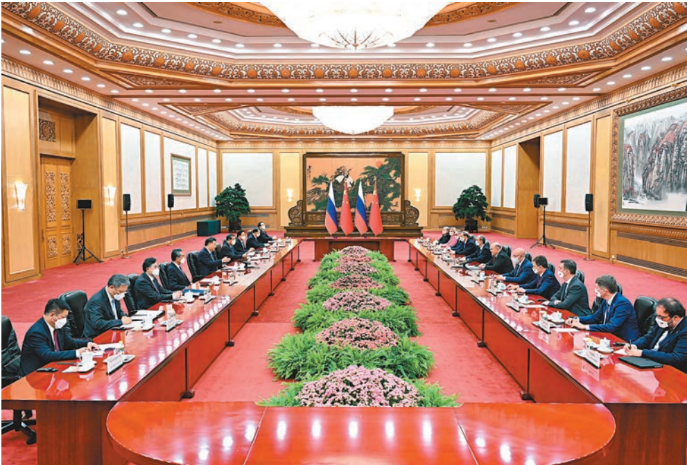
▲ 5月24日下午，國家主席習近平在北京人民大會堂會見來華進行正式訪問的俄羅斯總理米舒斯京。