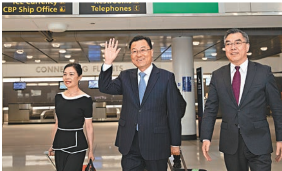
◆ 5月23日，紐約肯尼迪國際機場，中華人民共和國新任駐美利堅合眾國特命全權大使謝鋒（中）抵達美國履新。

毛寧指出，中美關係對中美兩國和世界都具有重大意義。中方始終按照習近平主席提出的相互尊重、和