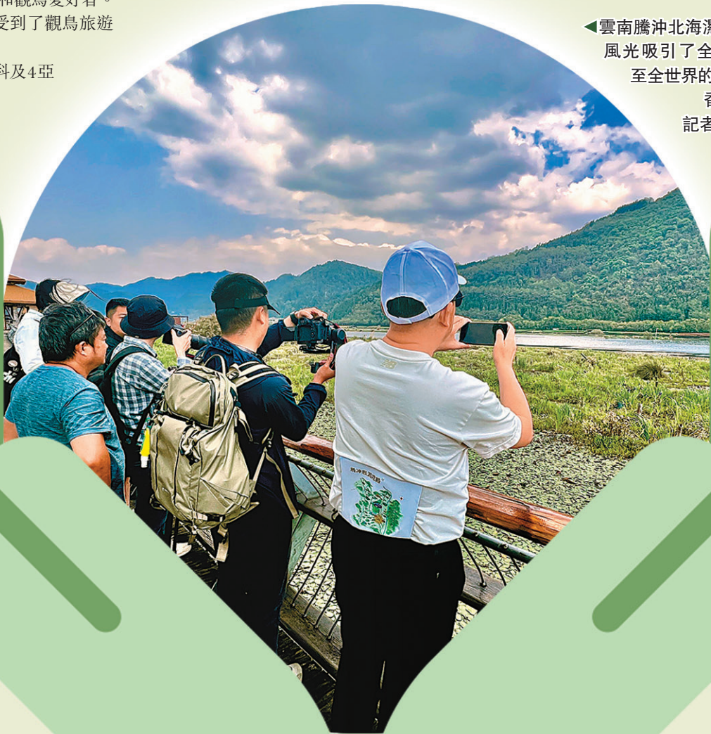
雲南騰沖北海濕地美麗的風光吸引了全國各地乃至全世界的遊客。

據了解，騰沖市實施濕地恢復工程十多年來，共投入濕地恢復生態補償金6,000餘萬元，濕地水位提升了1.8m，北海濕地面積由原來807畝擴大至3,400餘畝，植被恢復1,800畝，生物多樣性得到有效保護和恢復。如今，北海濕地水域更寬廣了，景色更美了，到北海濕地旅遊觀光的人更多了，濕地周邊群眾增收致富的渠道拓寬了。如今，北海濕地年接待遊客約50萬人次，實現旅遊收入5,000餘萬元，濕地周邊群眾依託生態旅遊發展特色農業及服務業，2021年雙海社區居民人均收入15,190元，是2015年人均收入的1.6倍、2011年的5.6倍。