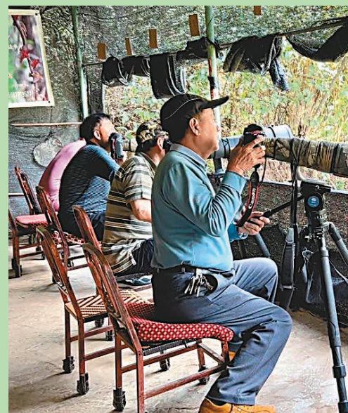
觀鳥聖地百花嶺村每年吸引1萬多人次的戶外徒步和觀鳥愛好者。