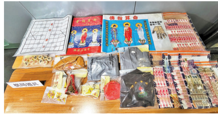
◆警方檢獲騙徒的道具，包括象棋、護身符、道士衣服、算命海報、佛鈴等。

香港文匯報訊（記者 蕭景源）警方就上周在灣仔及紅磡區發生的兩宗街頭「棋局」扒竊及搶掠案經深入調查後，前日在旺角一賓館及落馬洲口岸合共拘捕3名持雙程證來港的內地男騙徒，更在他們藏身的賓館內檢獲大量疑用作行騙的祈福道具，包括道士服裝、算命海報、超過200個護身符等。相信他們與另外一些街頭「祈福黨」騙案有關。警方認為類似的傳統街頭騙案有死灰復燃跡象，呼籲市民小心提防。若早前曾被騙，應盡快報警求助。