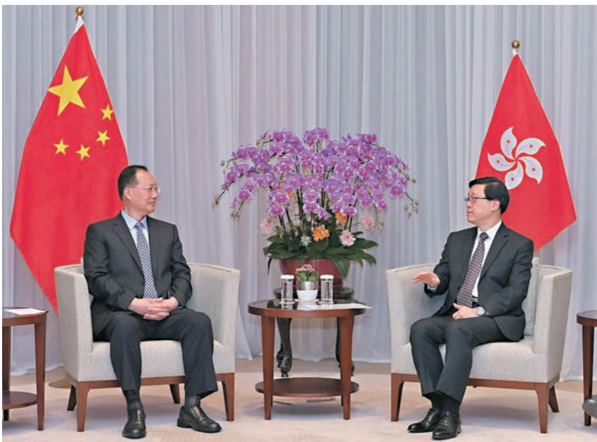
◆行政長官(右)與湖南省省長毛偉明會面。

他指香港特區政府早在2016年設立駐湖南聯絡處，以深化兩地在經貿、文化、旅遊等不同領域的合作，並為在湖南的港人港企提供支持。