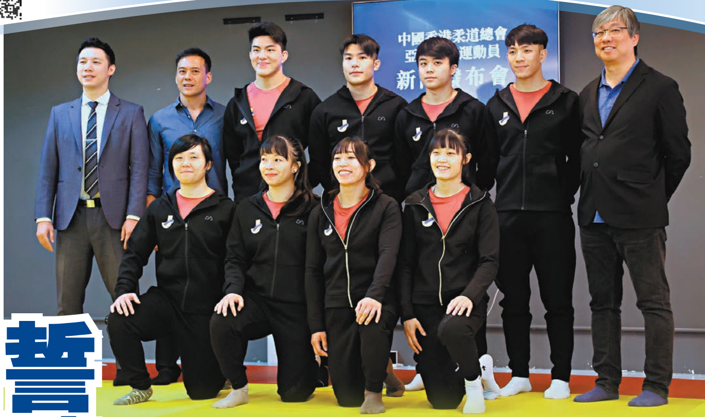
◆為了專心備戰，柔總昨提早公布港隊亞運大軍名單。