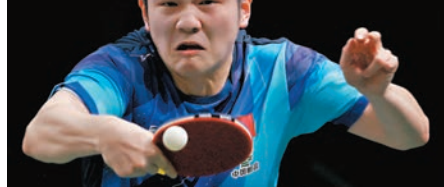
◆樊振東在今屆世乒賽起到領軍作用。

混雙組長蕭戰表示，國乒兩對混雙組合較好地完成了本次比賽任務，其鍛煉價值遠遠大於現在所取得的成績。備戰奧運會的過程中，參加混雙的運動員必須學會快速調整，以便在單打、雙打、混雙三項比賽中實現「快速轉換」。同時，中國隊組合還需要繼續打磨技術，因為隨着對手實力的提升，中國隊隊員面臨的衝擊也越來越大。