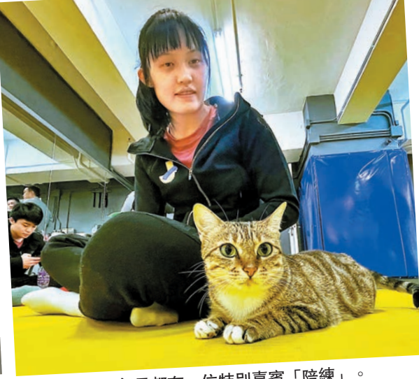
◆香港柔道隊每日都有一位特別嘉賓「陪練」。