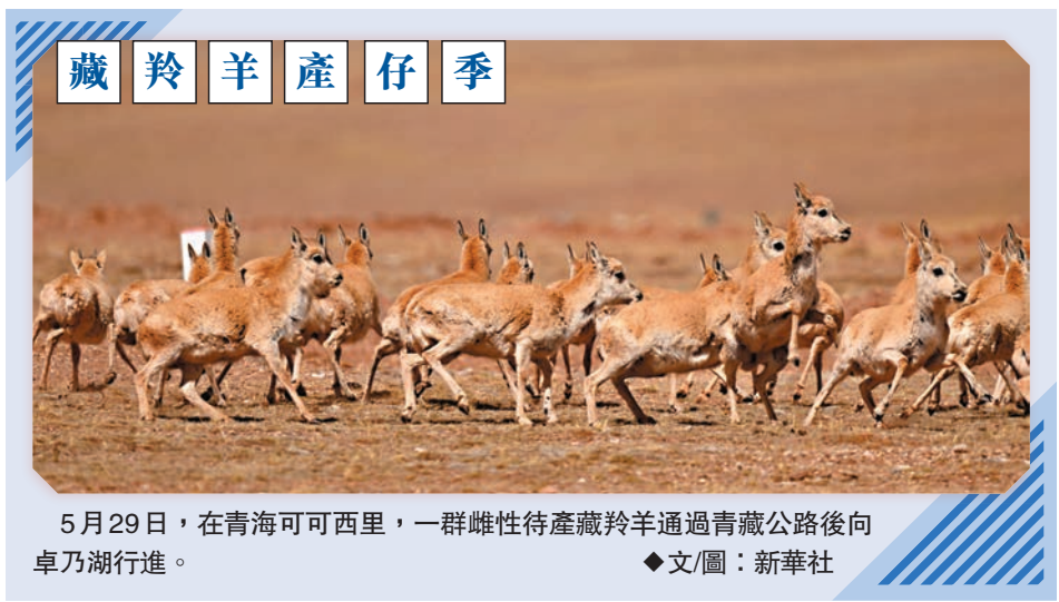
5月29日，在青海可可西里，一群雌性待產藏羚羊通過青藏公路後向卓乃湖行進。

今年的峰會舉辦地從北京搬到了上海，兩天時間裏，包括輝瑞、百度和星巴克首席執行官在內的中美兩國多位商界重量級人物將現身會場。剛剛迎來百歲生日的美國前國務卿基辛格，也將與另一名美國前國務卿賴斯一道出席一場線上圓桌會議。根據彭博社的報道，活動將以摩根大通亞太區CEO郭利博（Filippo Gori）的講話「我們回來了！」（We are Back!）作為閉場。