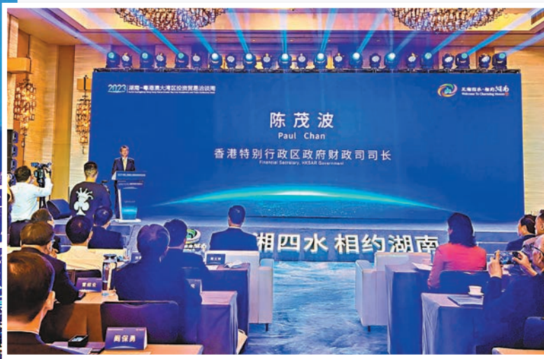
▲香港特區政府財政司司長陳茂波出席活動並致辭。