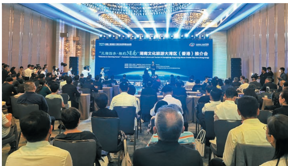
◆「三湘四水·相約湖南」湖南文化旅遊大灣區（香港）推介會現場。

香港文匯報訊（記者 姚進）「三湘四水·相約湖南」湖南文化旅遊大灣區（香港）推介會昨日下午在香港舉行，湖南省在會上介紹了該省發展文化和旅遊的政策和目標，並向與會者推介「五張名片」。湖南省省長毛偉明、香港特區政府財政司司長陳茂波出席活動並致辭。活動現場還舉行了「港—湘旅行商合作簽約」儀式，現場有8家企業6家協會現場簽訂了合作協議。