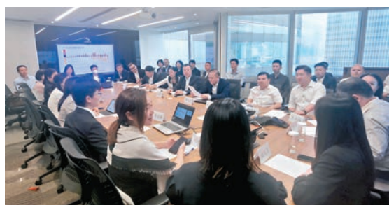
◆湖南省地方金融監督管理局舉辦「走進香港交易所」活動，9家擬赴港上市企業及部分中介機構負責人與香港交易所領導及專家現場交流。

對企業境外主流資本市場上市參照A股上市給予同等支持，每年舉辦境外上市宣傳培訓活動，深入企業調研走訪，積極協助解決企業境外上市過程中的困難和問題，支持企業境外上市。