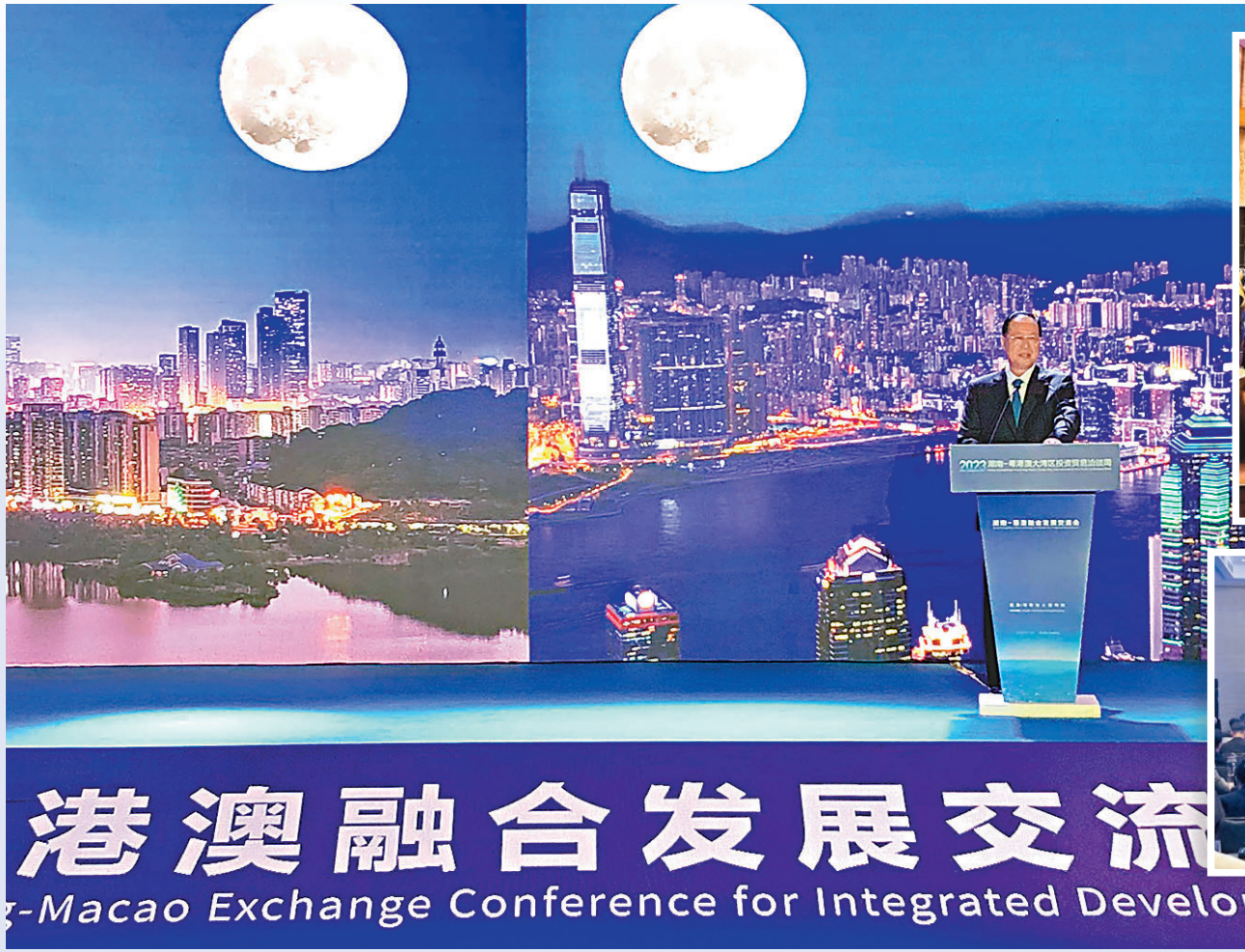
◆湖南省省長毛偉明出席湖南—港澳融合發展交流會並致辭。