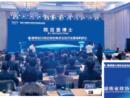
▲香港特區政府商務及經濟發展局局長陳百里出席會議。