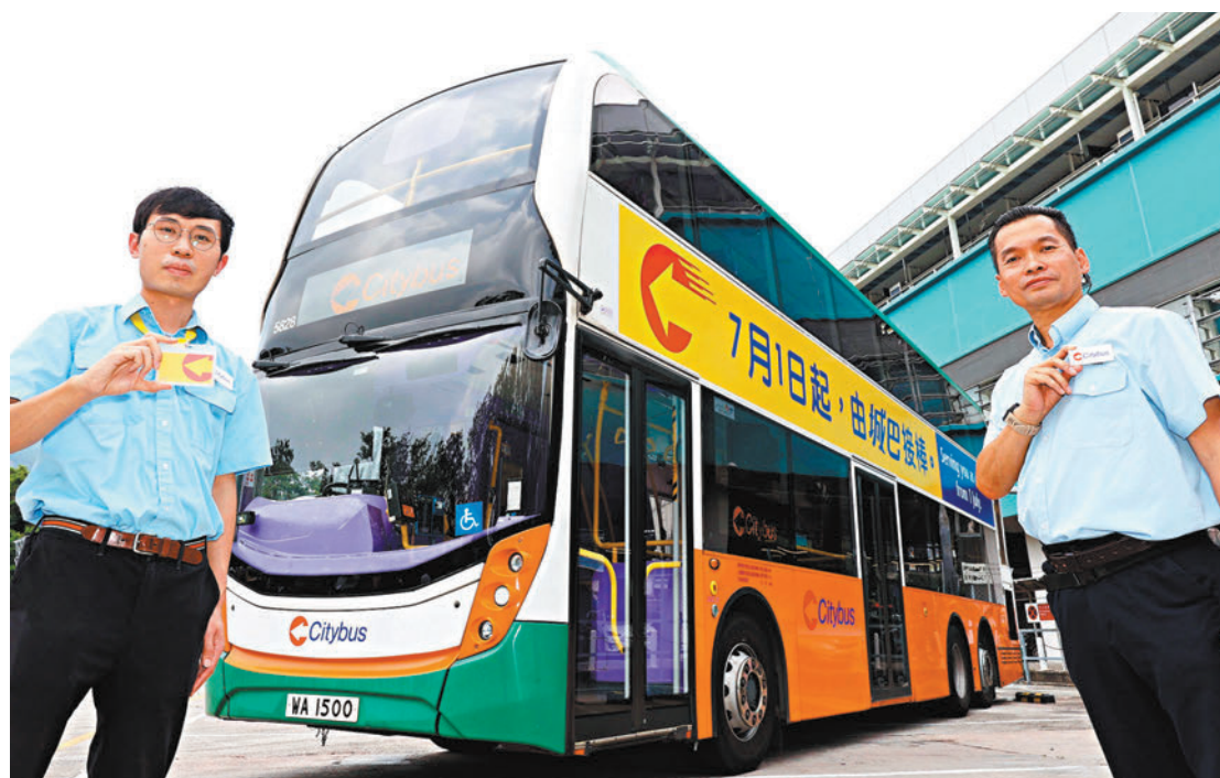
◆ 城巴革新形象迎接與新巴專營權合併。

五間巴士公司6月中起加價3.9%至7%。立法會文件顯示，城巴和新巴的市區線加價後，今年將僅僅達收支平衡，未來兩年料能錄得中等水平的固定資產平均淨值回報。政府建議拓展非票務收入，除了現時的車身廣告，也可以增設集運用的智能櫃，或讓巴士車廠的電動車充電裝置，供