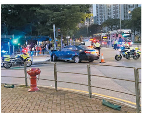
案中毒品快餐車失控撞向路中交通燈柱停下。

香港文匯報訊（記者 蕭景源）本周一（5月29日）晚上，一輛毒品快餐車在粉嶺過交警查時，懷疑吸毒的司機駕車狂飆，多次越過雙白線、衝紅燈及撞中的士，最終失控撞向安全島交通燈柱停下。司機棄車拋毒逃跑，一度掙脫警員，至少有4名市民出手相助，與警員合力將狂漢制服。該男子涉嫌「七宗罪」被捕。警方昨日感謝協助警員拘捕疑犯的熱心市民，認為事件充分顯示出警民合作滅罪的正能量。