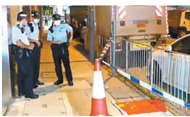
警方2022年10月3日亦在土瓜灣上鄉路邊發現有國旗遭到破壞。

案件其後安排轉庭處理求情，留下女親友陪同被告。辯方代表希望法庭縮短索取報告時間，李官則指辯方可以勸服其當事人，以免其情緒影響聆訊。在求情完畢後，被告仍在哭叫：「我唔要去懲教署呀……」最終步入羈留室。