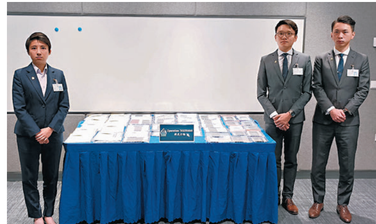
警方講述「搏虎」行動偵破108宗騙案詳情，並提醒學生搵暑期工時要小心求職陷阱。