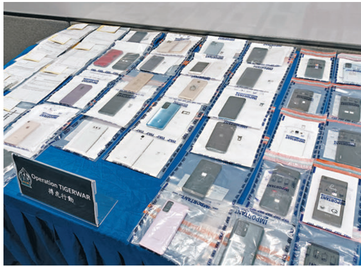
警方記者會上展示檢獲大量手提電話、銀行文件及提款卡等證物。