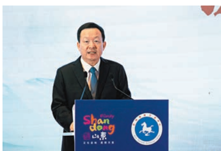
山東省省長周乃翔推介山東文旅資源。