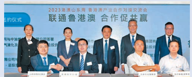
魯港澳產業合作對接交流會在香港舉行。現場簽約9項重大項目，項目總金額達93億元。

香港特區政府創新科技及工業局副局長張曼莉，香港貿發局華北、東北首席代表陳嘉賢，山東省台港澳工作辦公室副主任尹曉民，荷澤市市長李春英等三方代表100餘人出席會議。