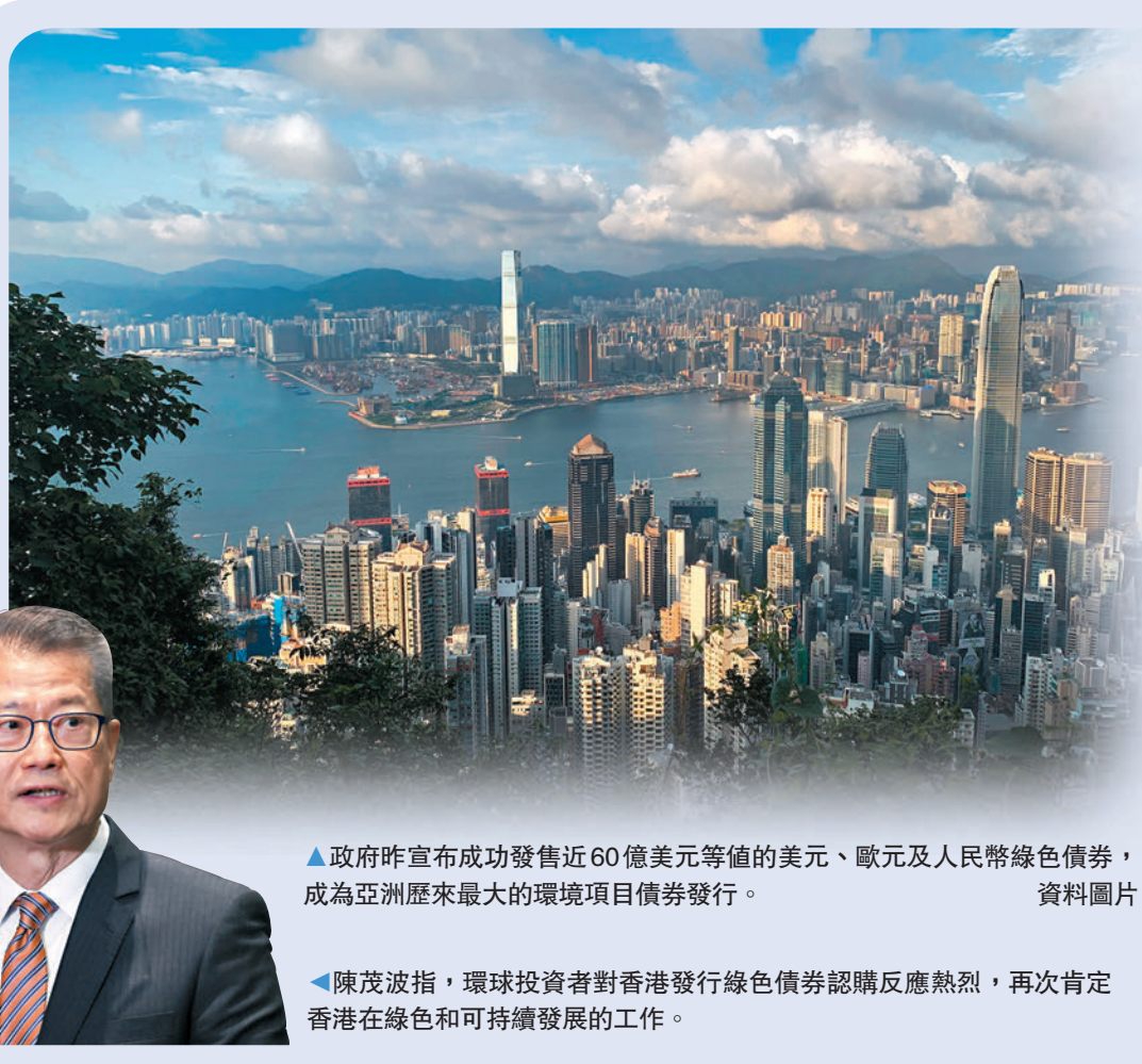
▲政府昨宣布成功發售近60億美元等值的美元、歐元及人民幣綠色債券，成為亞洲歷來最大的環境項目債券發行。資料圖片

此外，政府發行綠債也有助推動綠色金融產品的創新，同時刺激市場對綠色金融產品的需求。另一方面，政府積極參與綠色金融市場，有利於香港金融機構學習先進的綠色金融理念和技術，提升金融業在綠色金融領域的專業水平，並為銀行、會計、法律、認證等相關的專業及人才帶來需求。