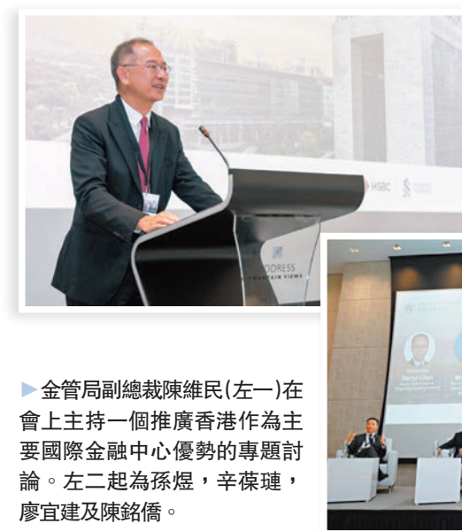
▲余偉文在阿聯酋的午餐會上作開場致辭。

司、家族辦公室、主權財富基金等機構投資者舉行會議，就擴大金融合作的一系列議題交換意見。在此之前，金管局與阿聯酋中央銀行於5月29日舉行雙邊會議，旨在加強兩個中央機構之間的合作。就今趟阿聯酋訪問之旅，余偉文形容是次訪問為進一步加強兩地的雙邊關係打好基礎，並有助推廣香港作為主要國際金融中心的角色。他又指深切感受到阿聯酋官方及私營部門均對加強整個金融生態圈的廣泛合作展現濃厚興趣和熱誠，將有助促進兩地在金融基建建立更緊密的聯通及金融機構之間的合作，為跨境貿易及投資帶來重大機遇。